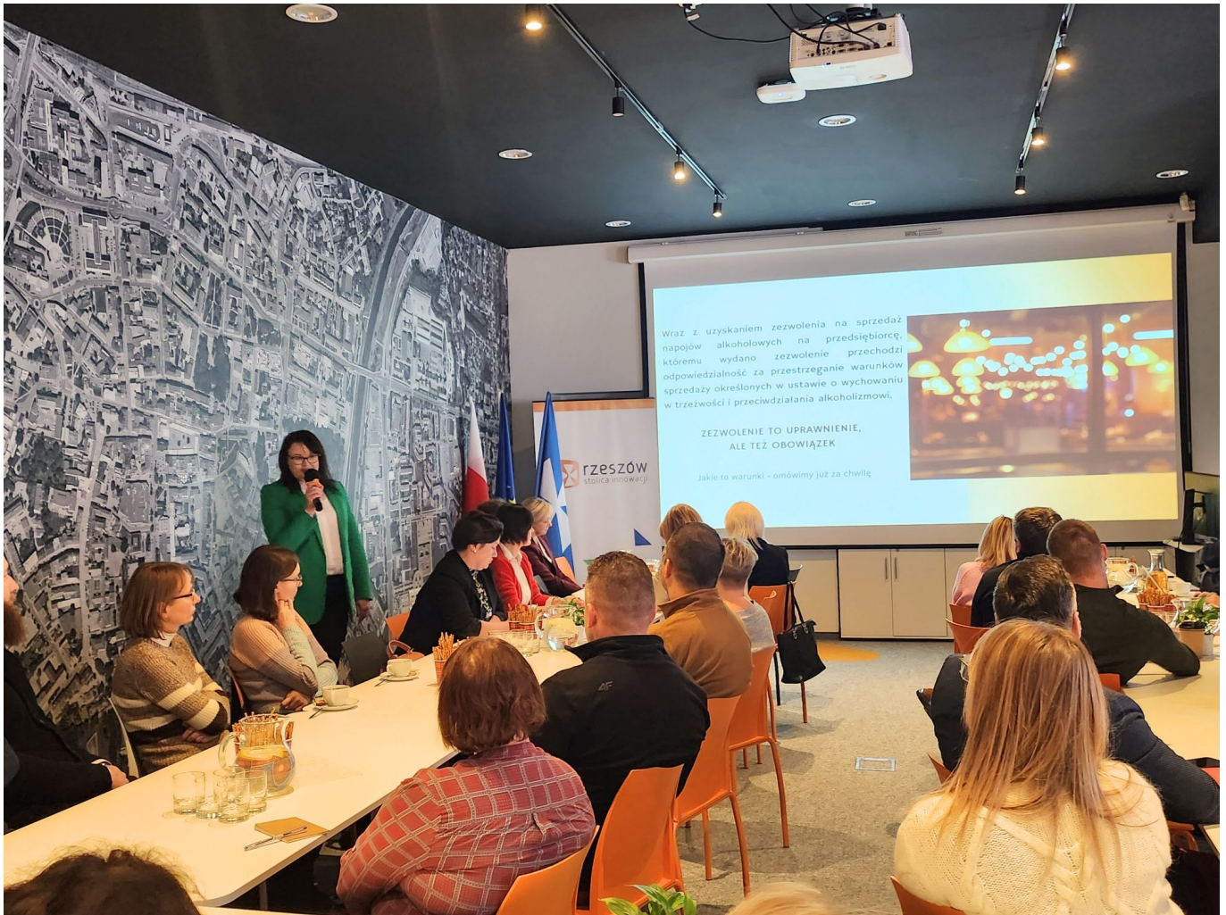
Spotkanie szkoleniowe dla przedsiębiorców prowadzących punkty sprzedaży napojów alkoholowych na terenie miasta Rzeszowa