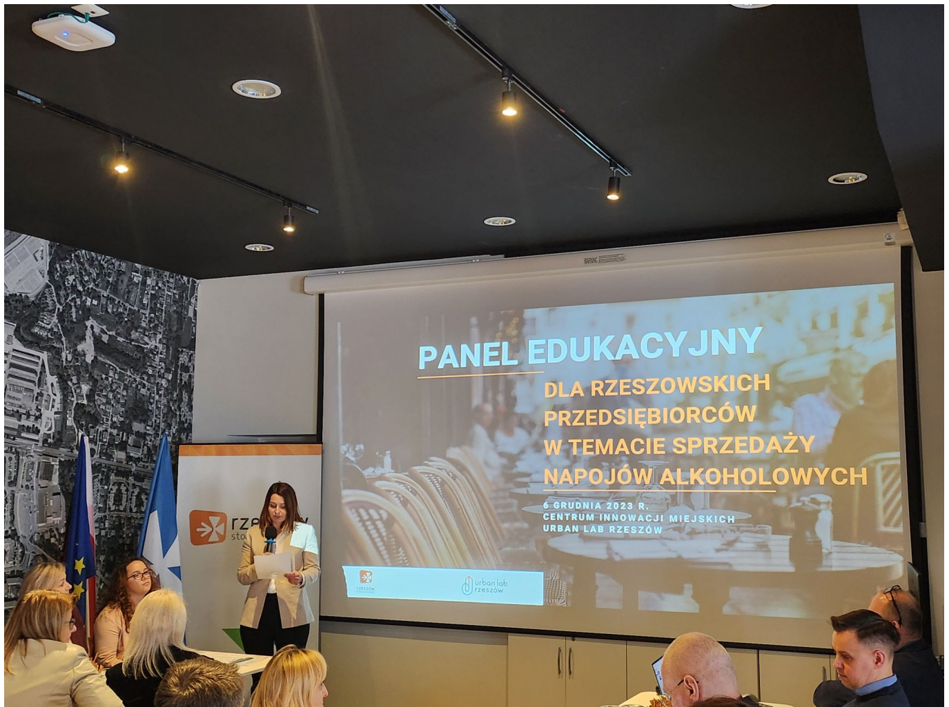
Spotkanie szkoleniowe dla przedsiębiorców prowadzących punkty sprzedaży napojów alkoholowych na terenie miasta Rzeszowa