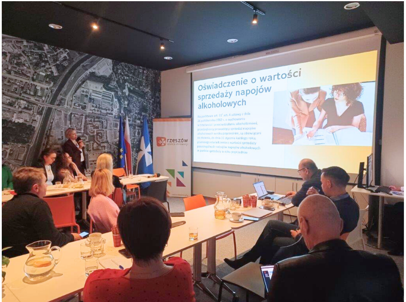
Spotkanie szkoleniowe dla przedsiębiorców prowadzących punkty sprzedaży napojów alkoholowych na terenie miasta Rzeszowa