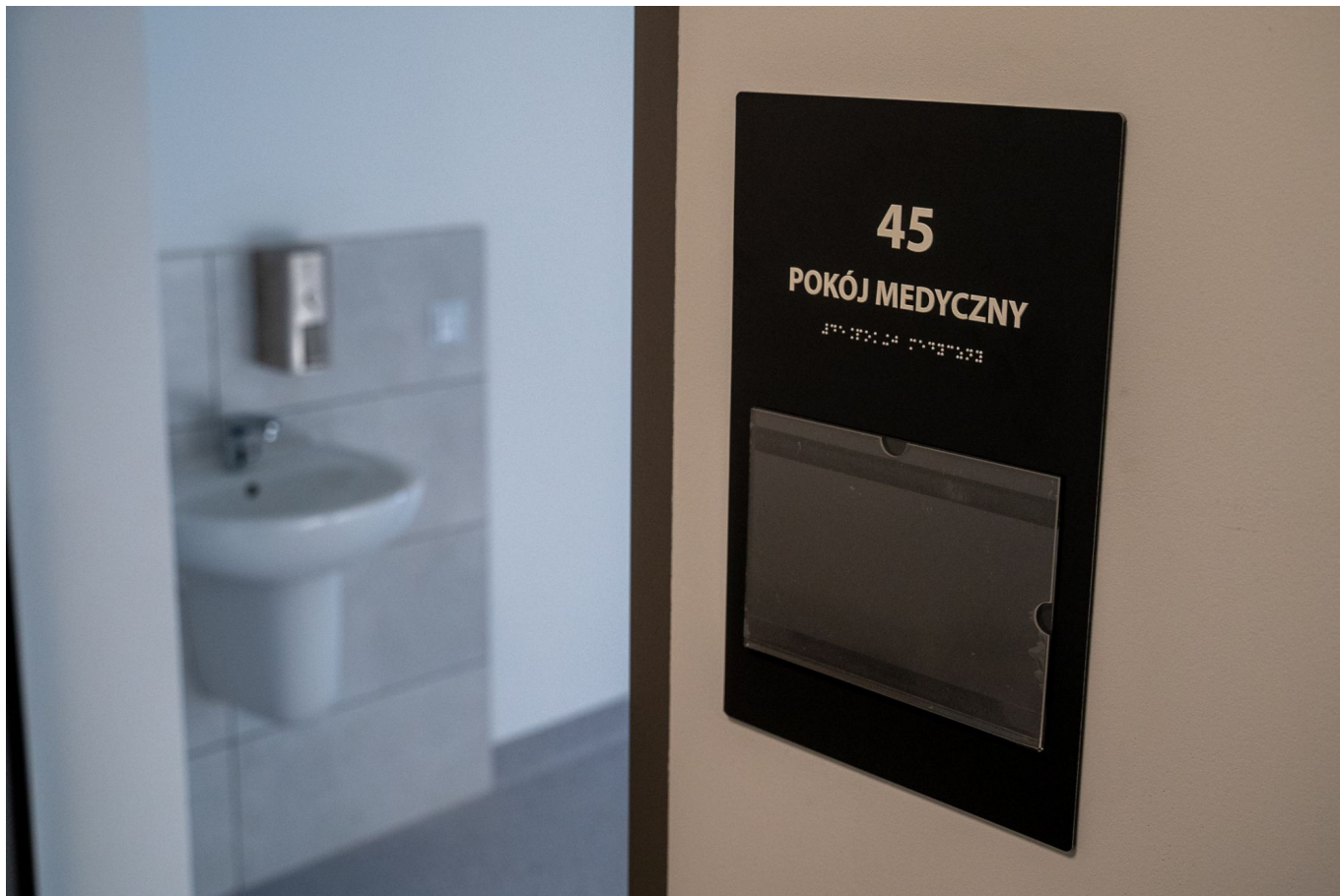
zdjęcie przedstawiające budowę Centrum Opiekuńczo-Mieszkalnego dla osób z niepełnosprawnością przy ul. Sucharskiego w Rzeszowie