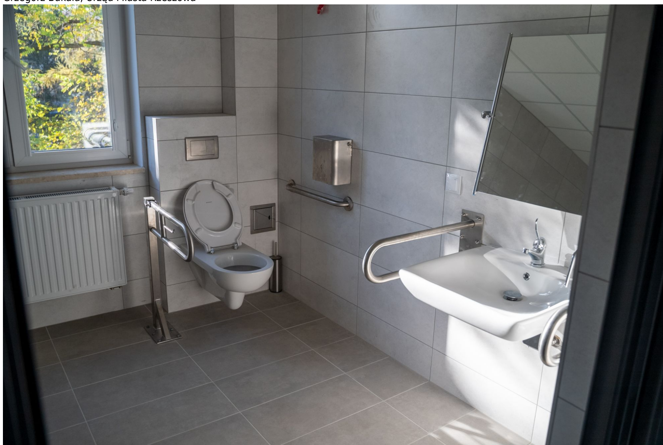
zdjęcie przedstawiające budowę Centrum Opiekuńczo-Mieszkalnego dla osób z niepełnosprawnością przy ul. Sucharskiego w Rzeszowie, fot. Grzegorz Bukała, Urząd Miasta Rzeszowa