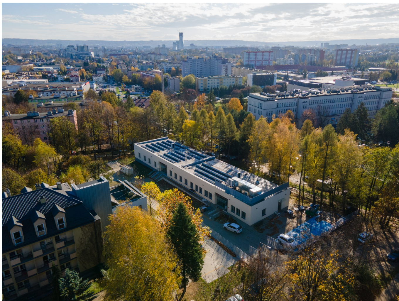
zdjęcie przedstawiające budowę Centrum Opiekuńczo-Mieszkalnego dla osób z niepełnosprawnością przy ul. Sucharskiego w Rzeszowie