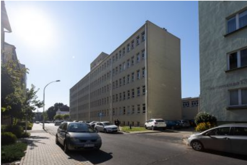
W miejscu rozebranej w latach 70. XX wieku "Januszkówki" stoi dziś skrzydło Przychodni Specjalistycznej Nr 3 przy ul. Hoffmanowej 8a.