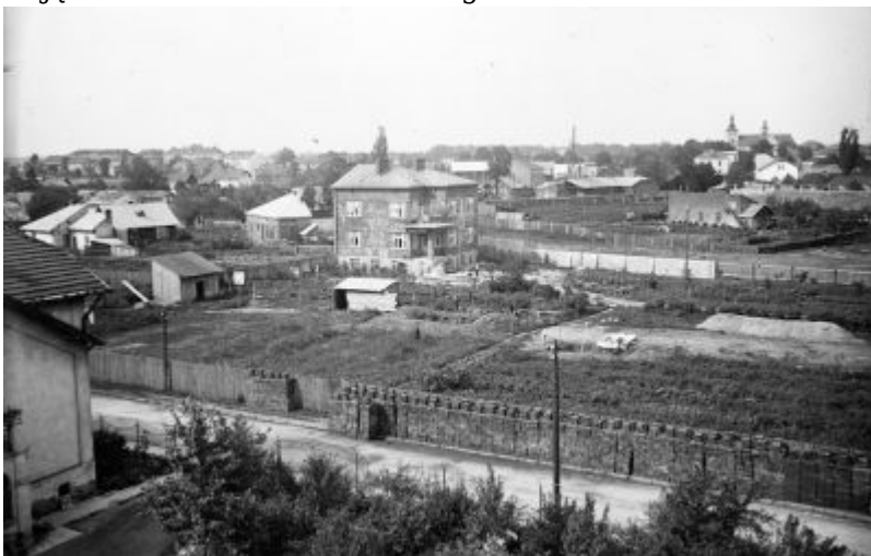
Późniejsza fotografia dokumentująca bardziej zaawansowany stan budowy willi. Zwraca uwagę, jak