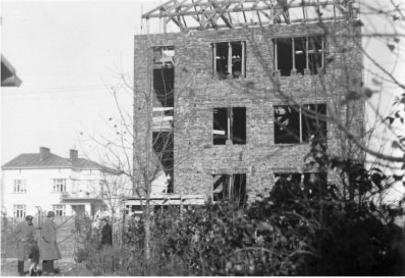
Fotografia z rodzinnego archiwum ukazująca budowę trzeciego z kolei domu Januszy, tj. modernistycznej kamienicy przy ul. Poniatowskiego 10. Zwraca uwagę, że nowy dom został wybudowany w granicy posesji należącej do willi Fryderyka, którą widzimy w tle. Zdjęcie ze zbiorów Galerii Fotografii Miasta Rzeszowa