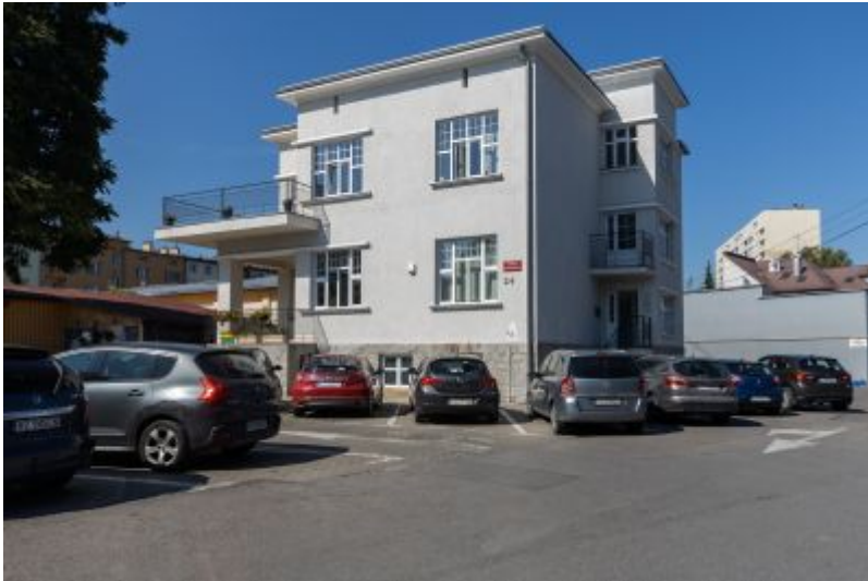
Willa Fryderyka Janusza, ob. siedziby Estrady Rzeszowskiej, współcześnie. Widok od strony południowo-wschodniej.