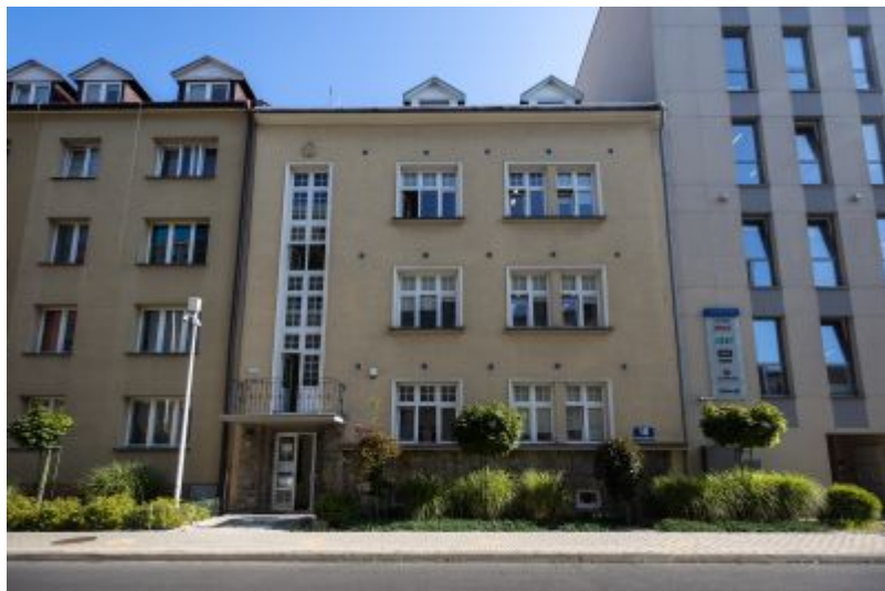
Zmodernizowana kamienica przy ul. Poniatowskiego 10 współcześnie.

Czy wiesz, że ... domów należących do rodziny Edwarda Janusza, wybitnego fotoreportera codzienności rzeszowian w dobie autonomii galicyjskiej, było aż trzy? Pierwszy został wyburzony, kolejny przekształcony i dziś tylko jedna z dawnych posiadłości Januszy zachowuje pamięć o tej zasłużonej dla miasta rodzinie, jak również kontynuuje kulturalną tradycję miejsca, które przez kilka dziesięcioleci żyło jej obecnością.