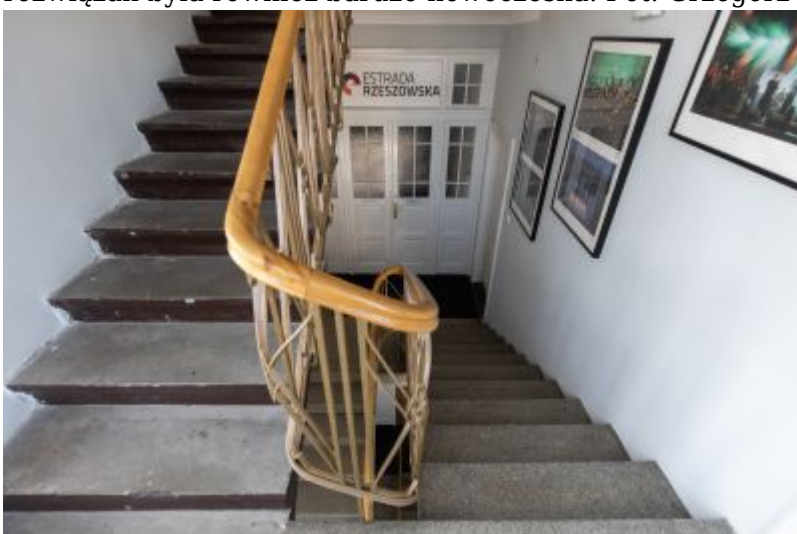
Wnętrze klatki schodowej willi Fryderyka Janusza. Widoczna balustrada w stylu art-déco, stopnie wyłożone lastriko oraz szlachetna stolarka drzwiowa.