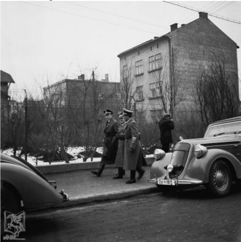
Fotografia z czasów drugiej wojny światowej przedstawiająca w tle ukończoną już kamienicę przy ul. Poniatowskiego 10 oraz po lewej stronie fragment ?Januszówki?.