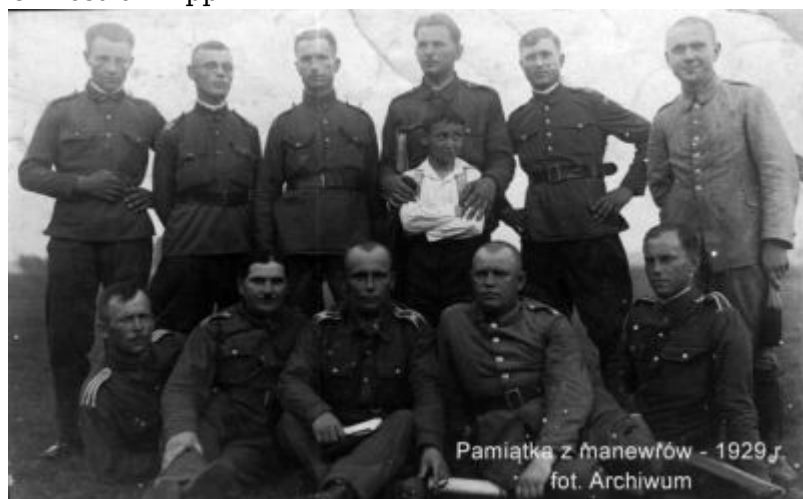
Pamiętkowe zdjęcie z manewrów w 1929 r.