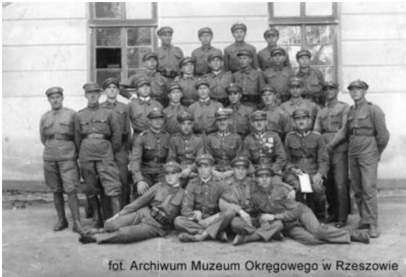
Żołnierze 17 pp

Już w dniu Wszystkich Świętych 1918 roku, czyli w pierwszym dniu niepodległości przystąpiono w Rzeszowie do formowania Pułku Piechoty Ziemi Rzeszowskiej.