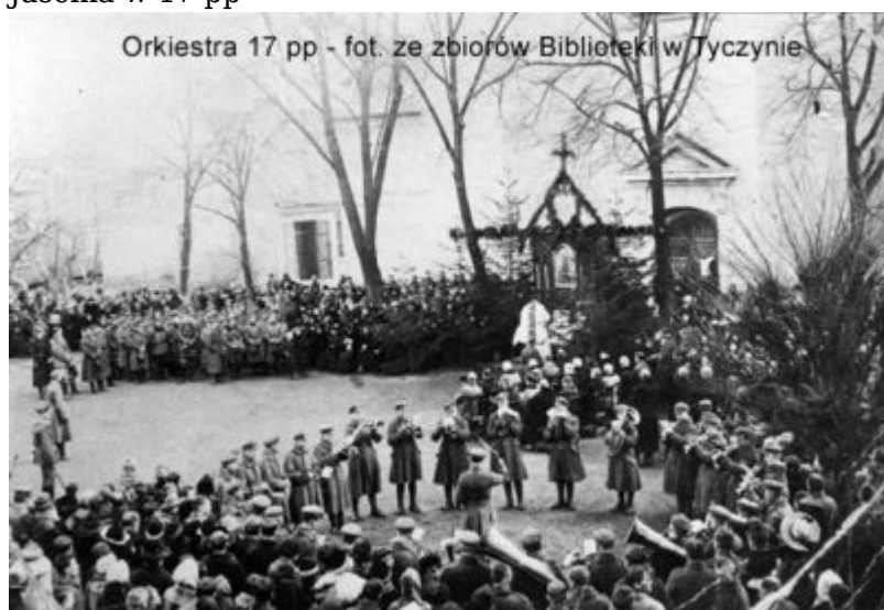
Orkiestra 17 pp