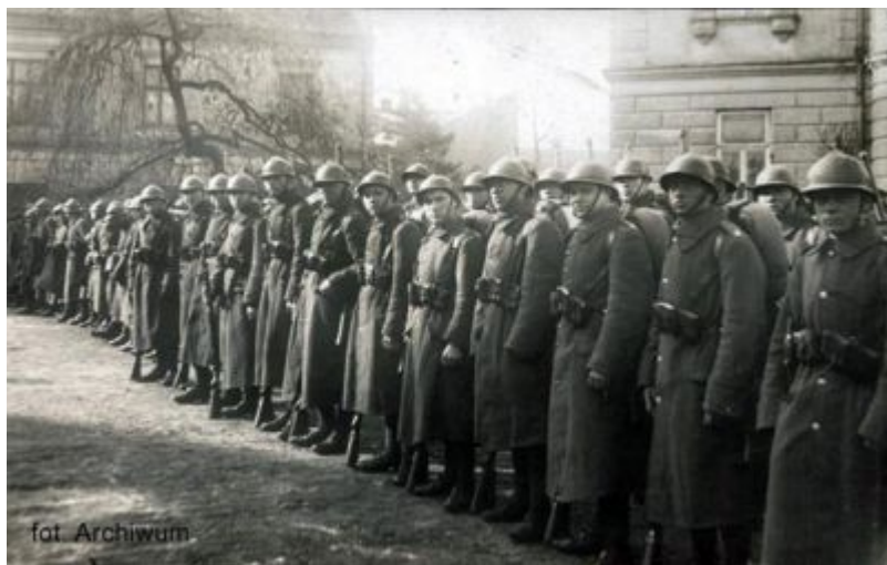
Żołnierze 17 pp