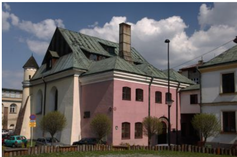
Synagoga Staromiejska