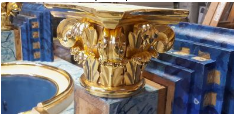
Ółtarzyk na finalnym etapie konserwacji estetycznej. Widać kapitel jednej z kolumn ze