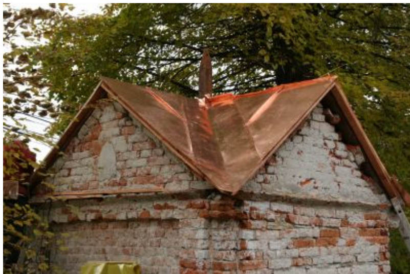
Odtworzone metodą rzemieślniczą pokrycie dachowe. Krycie wykonano blachą miedzianą "na felc" zgodnie z pierwotną technologią.