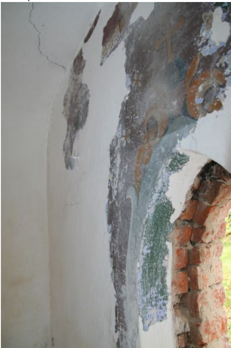
Polichromia w trakcie jej odsłaniania spod wtórnych powłok malarskich