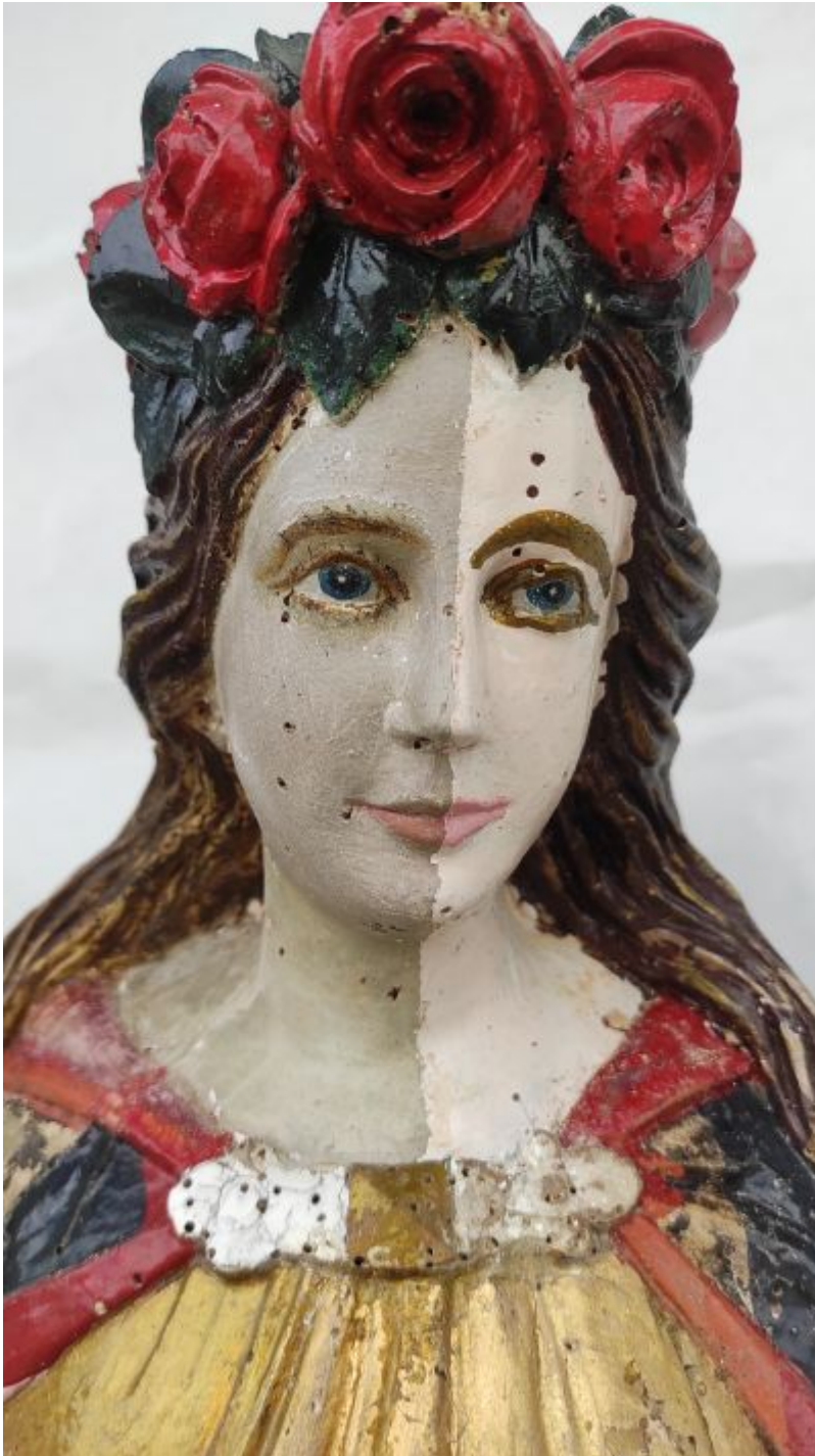
Rzeźba Św. Rozalii w trakcie usuwania przemalowań. Rzeźba od czasów jej powstania została kilkakrotnie przemalowana. Zidentyfikowano kilka nieautorskich i nieoryginalnych powłok malarskich, które zostały usunięte.