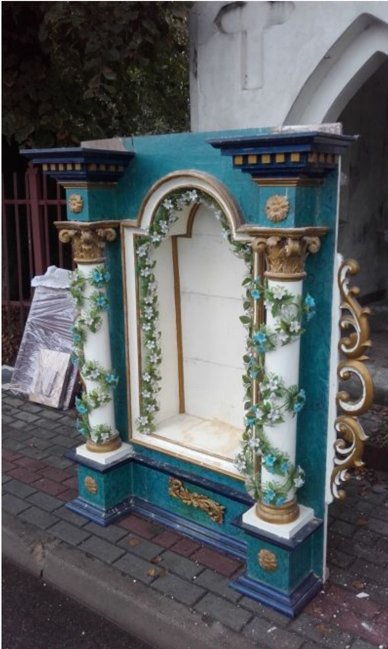
Rok 2014. Przygotowania do prac. Demontaż wyposażenia kapliczki, które przewiezione zostanie do budynku pobliskiej parafii. Na zdjęciu ołtarzyk czekający na transport.