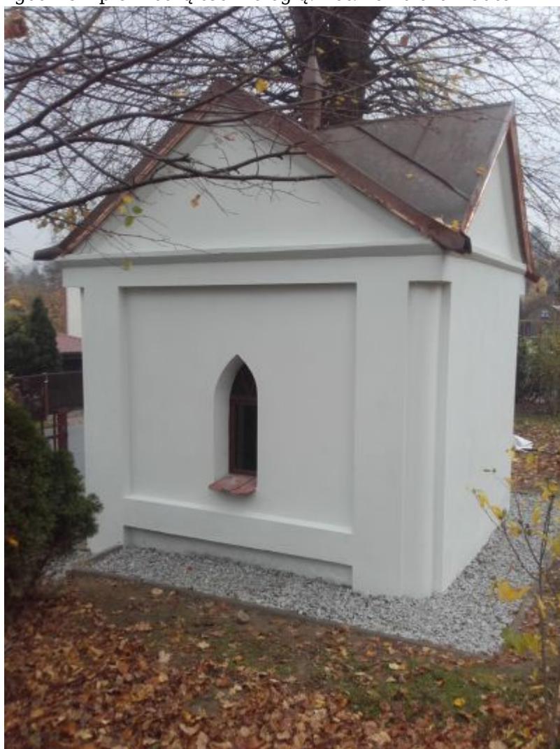
Widok kapliczki od strony ogrodu. Stan po wykonanych pracach remontowo-konserwatorskich obejmujących m.in. rekonstrukcję tynków z odtworzeniem podziałów architektonicznych, konserwację drewnianej stolarki drzwiowej i okiennej oraz wprawienie barwnych przeszkleń.