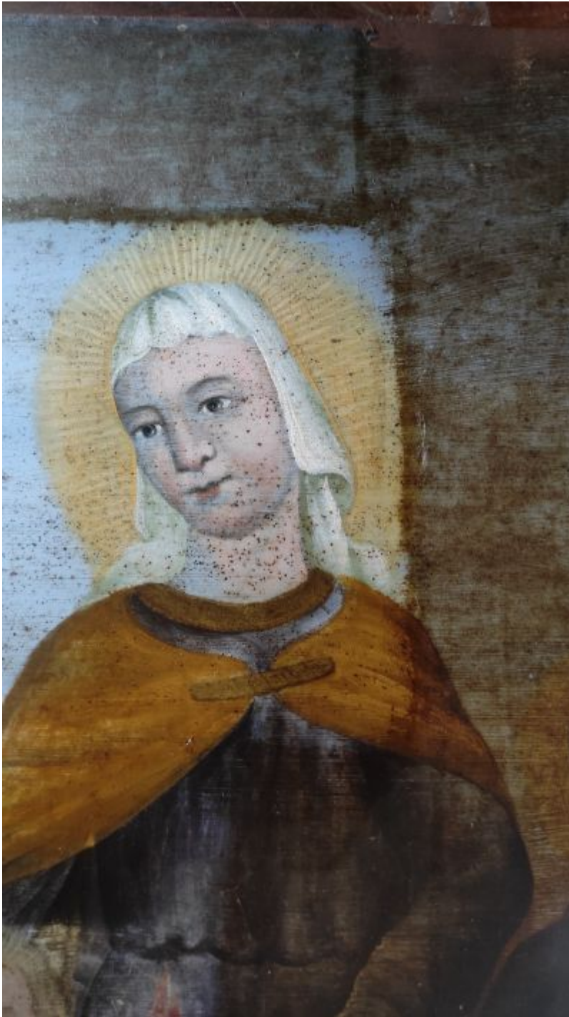
Fragment obrazu na blasze z przedstawieniem Św. Zofii. Etap chemicznego usuwania zbrązowiałej, pociemniałej warstwy pokostu, którym pokryty został obraz. Odśłania się pierwotna, żywa kolorystyka. Jednocześnie widać skalę korozji metalowego podłoża, na którym namalowany został obraz oraz całą masę drobnych ubytków warstwy malarskiej.