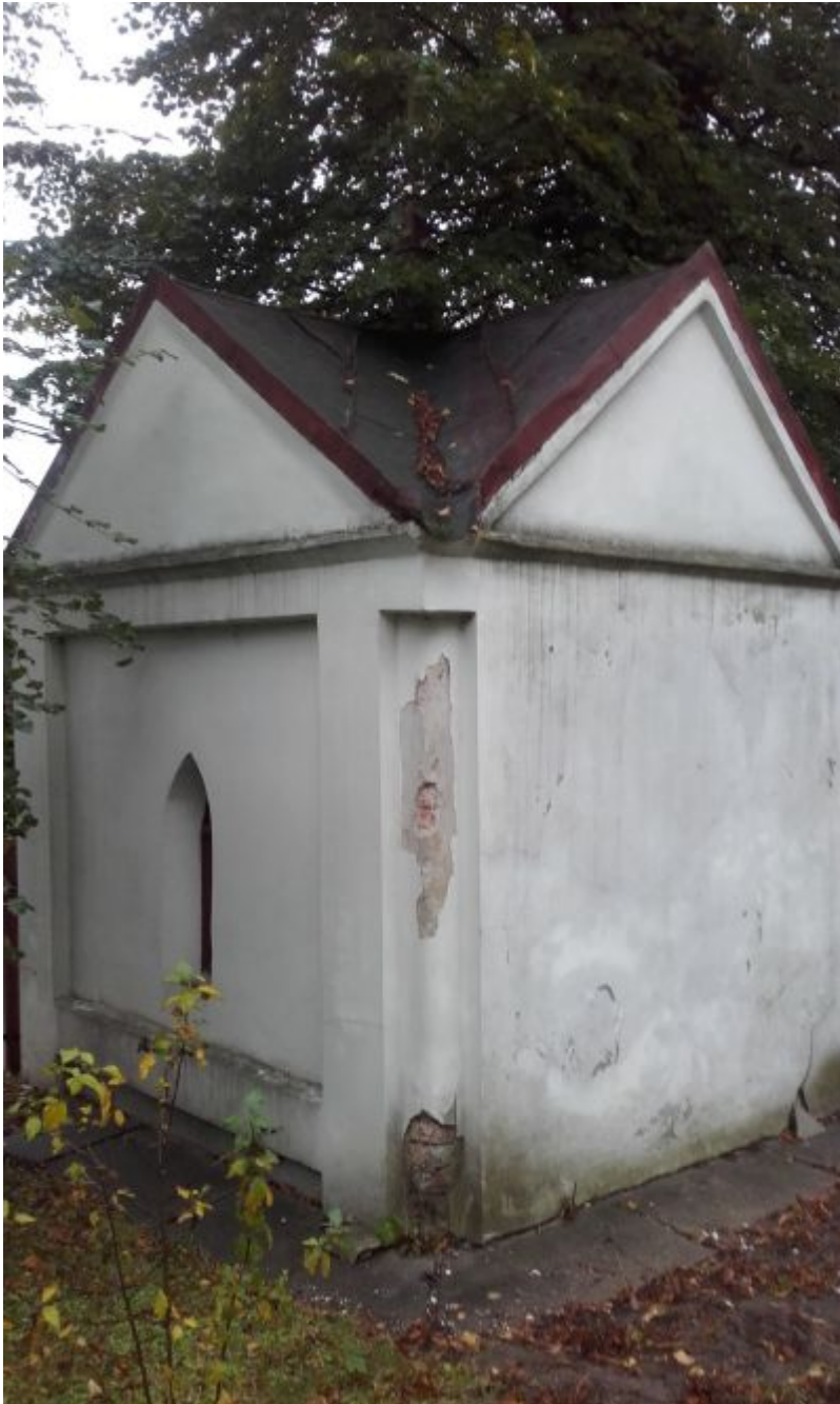
Rok 2014. Ujęcie kapliczki od strony ogrodu. Widać zawilgocenia ścian i wypraw tynkarskich, ich zmurszałość, spękania, miejscowe ubytki i odspajanie od wątku.