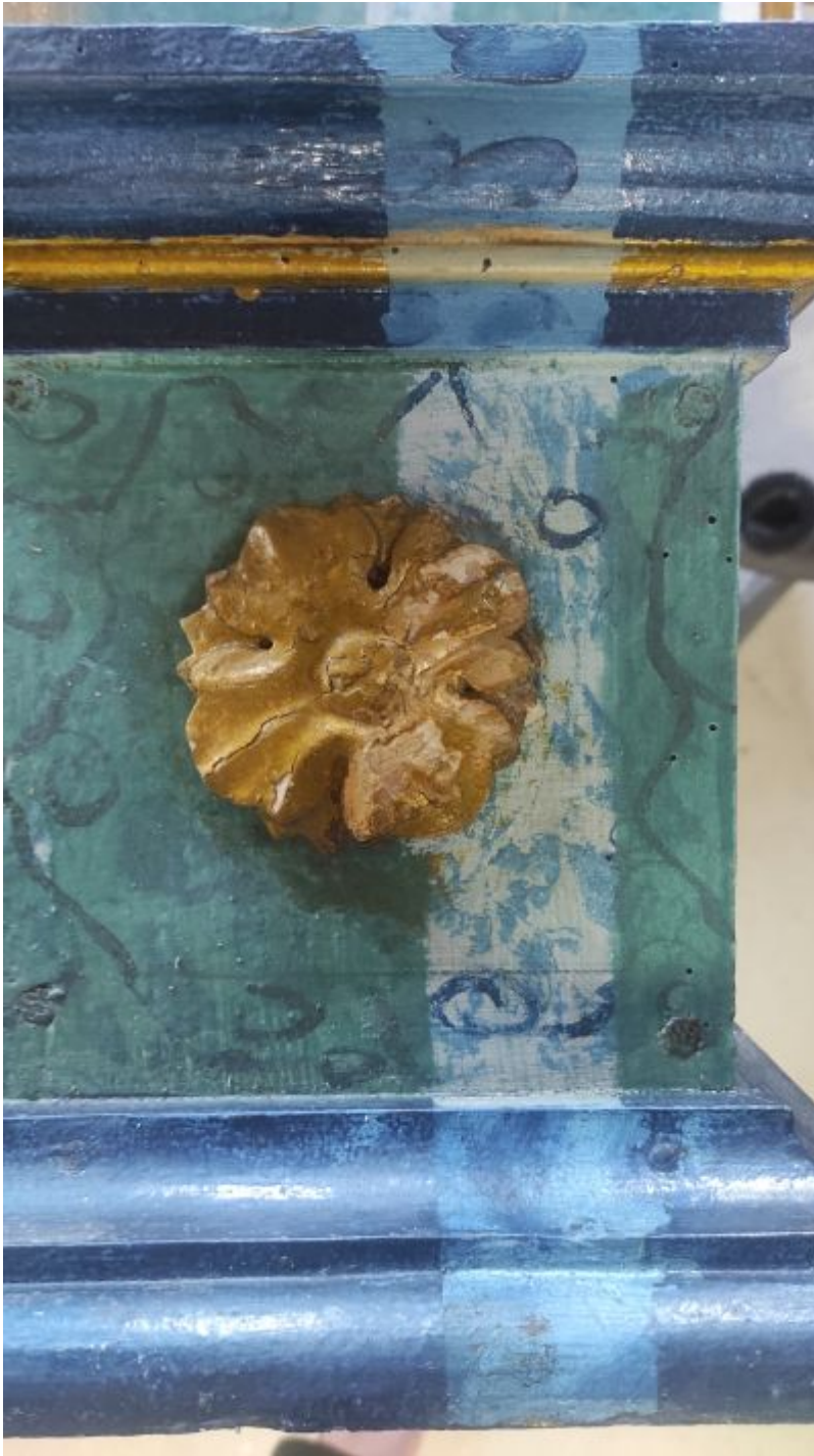
Fragment ołtarzyka ukazujący odkrywkę pasową z czytelną, dobrze zachowaną oryginalną warstwą marmoryzacji tj. imitacji marmuru wykonanej w technice malarskiej na drewnianej strukturze.