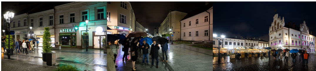
Spacer konsultacyjny z mieszkańcami