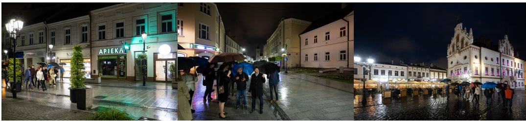
Spacer konsultacyjny z mieszkańcami