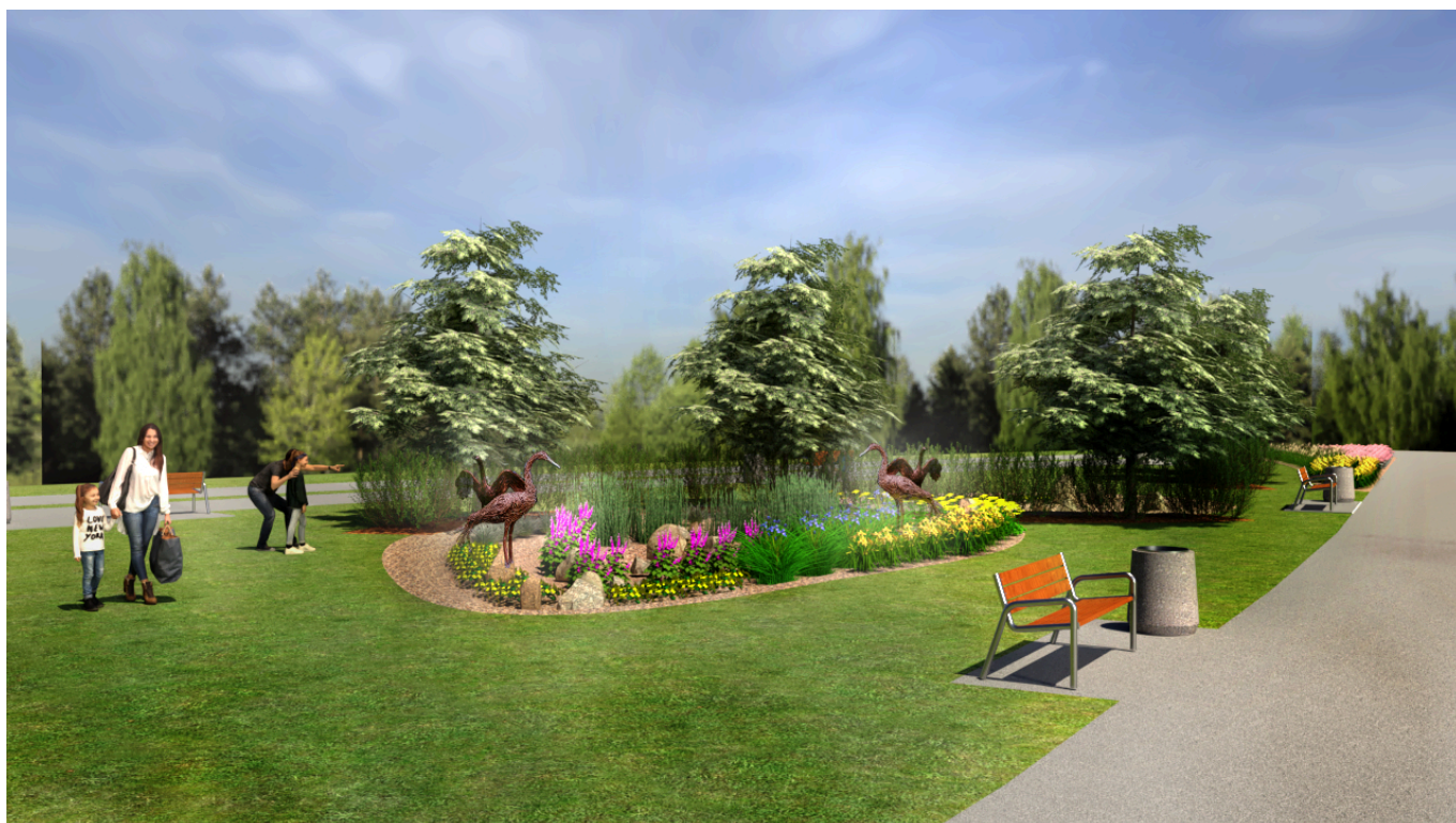
wizualizacja, Zarząd Zieleni Miejskiej w Rzeszowie