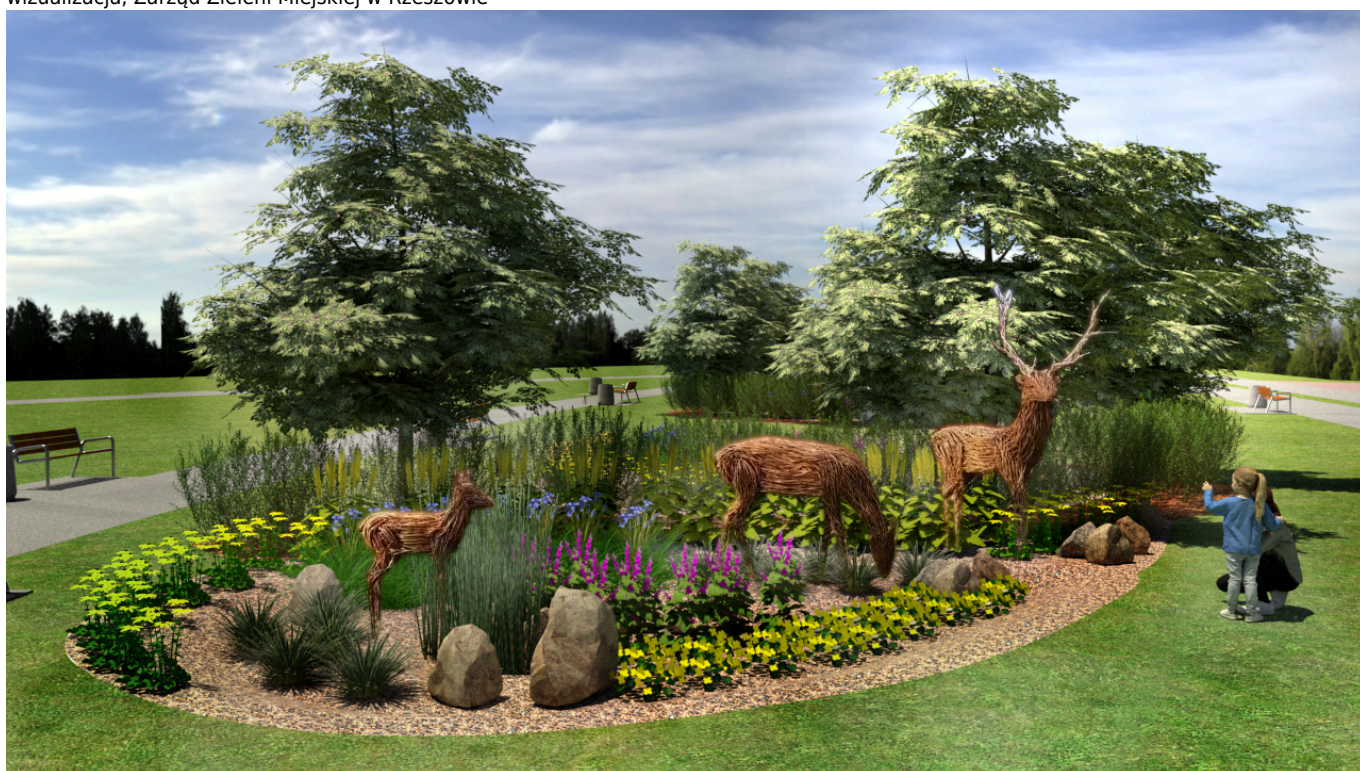
wizualizacja, Zarząd Zieleni Miejskiej w Rzeszowie