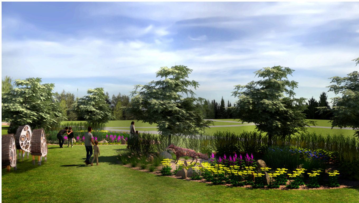
wizualizacja, Zarząd Zieleni Miejskiej w Rzeszowie