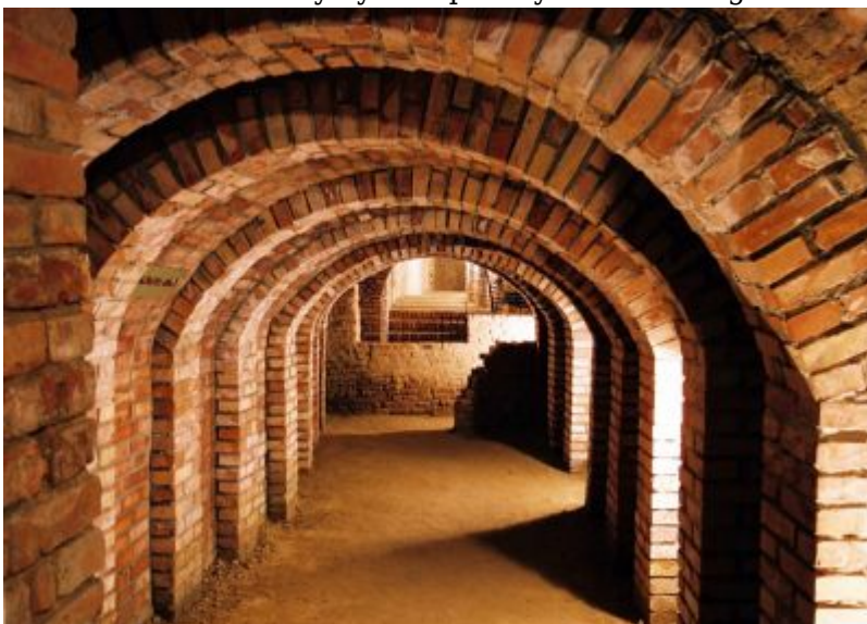
Podziemna Trasa Turystyczna pod Rynkiem Starego Miasta w Rzeszowie