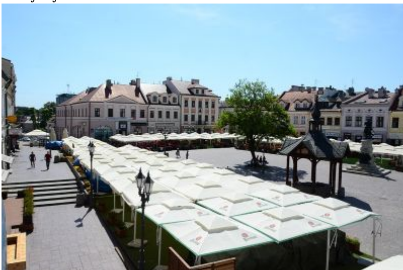
Stary Rynek w Rzeszowie