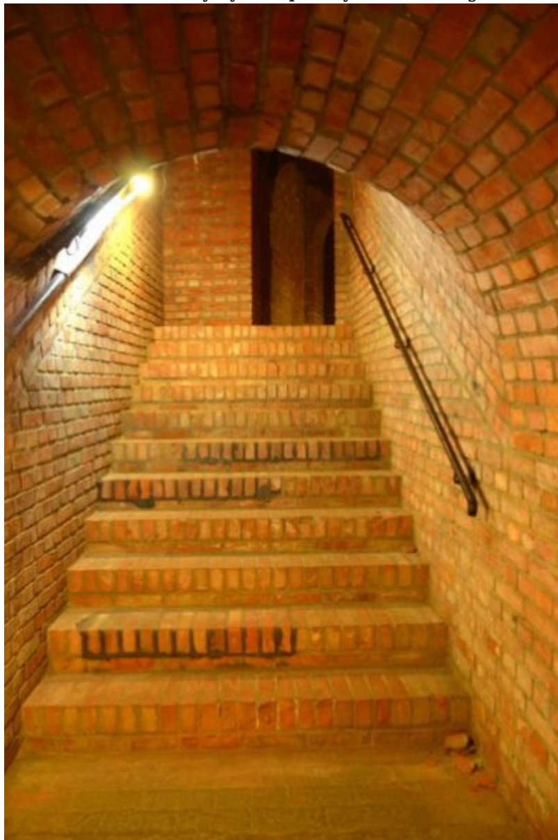
Podziemna Trasa Turystyczna pod Rynkiem Starego Miasta w Rzeszowie