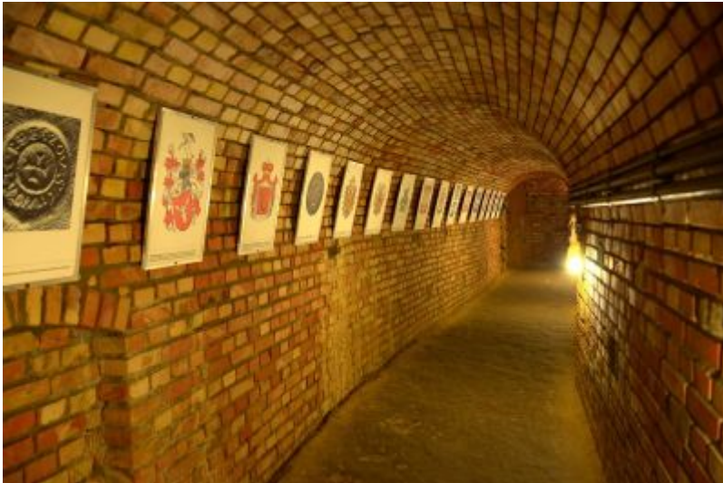
Podziemna Trasa Turystyczna pod Rynkiem Starego Miasta w Rzeszowie