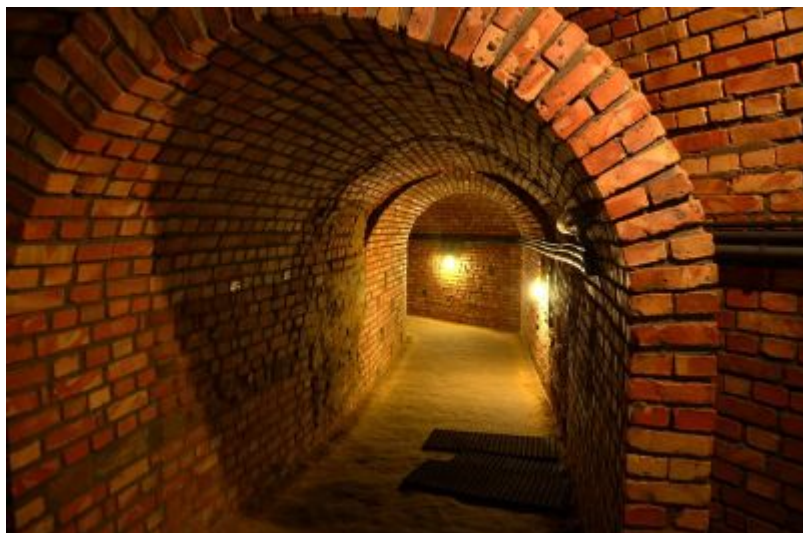
Podziemna Trasa Turystyczna pod Rynkiem Starego Miasta w Rzeszowie