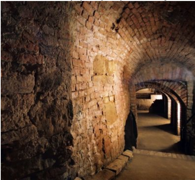
Podziemna Trasa Turystyczna pod Rynkiem Starego Miasta w Rzeszowie