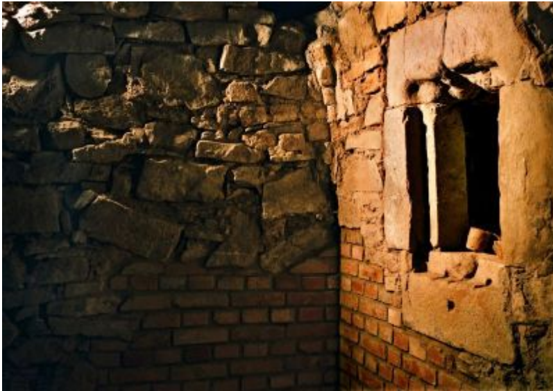
Podziemna Trasa Turystyczna pod Rynkiem Starego Miasta w Rzeszowie