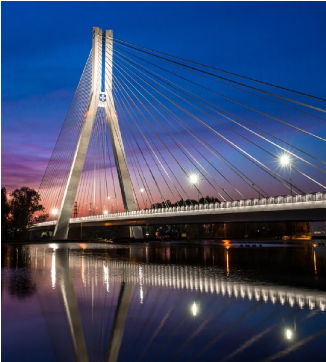
Most im. Tadeusza Mazowieckiego