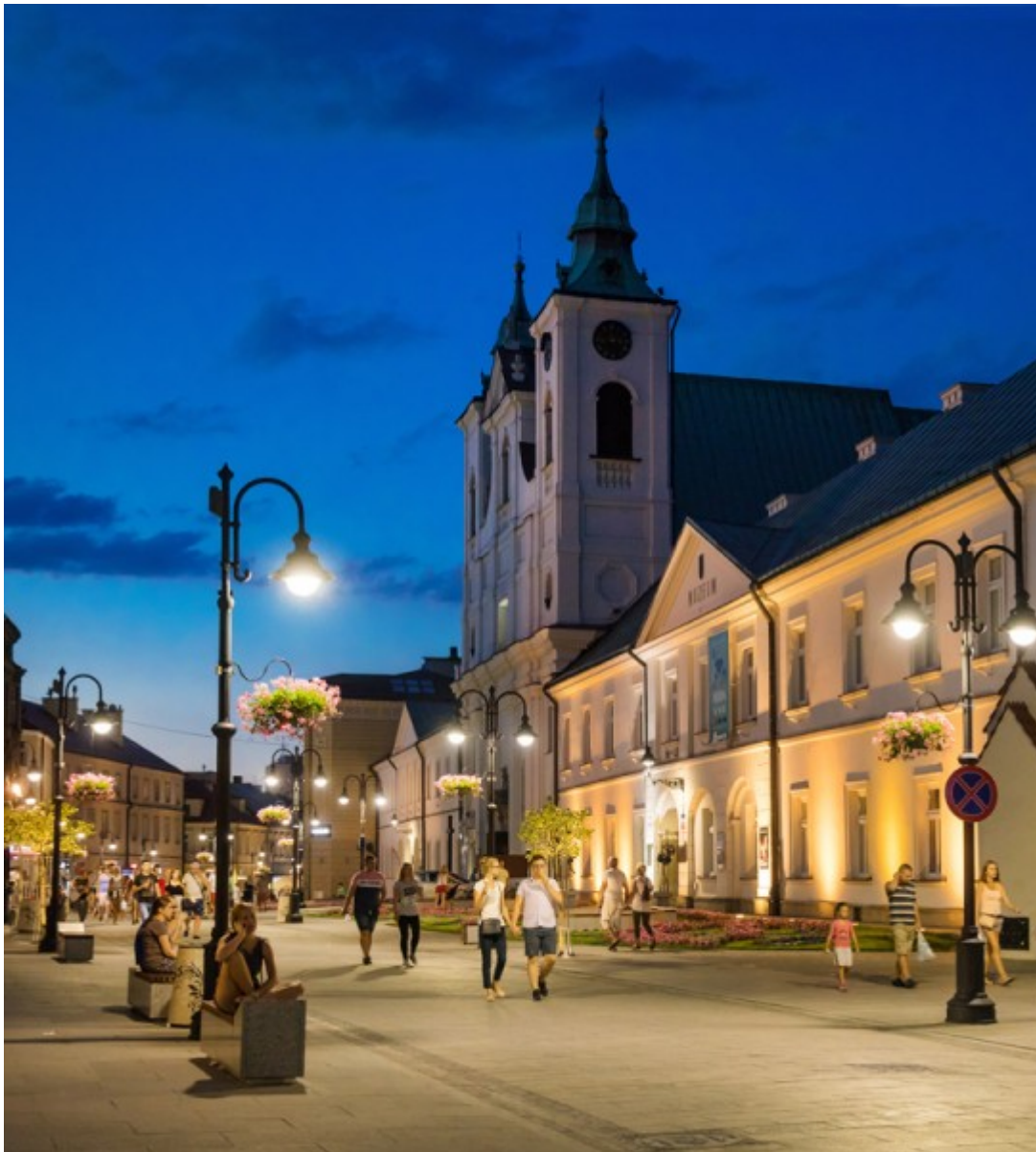
Ulica 3 Maja