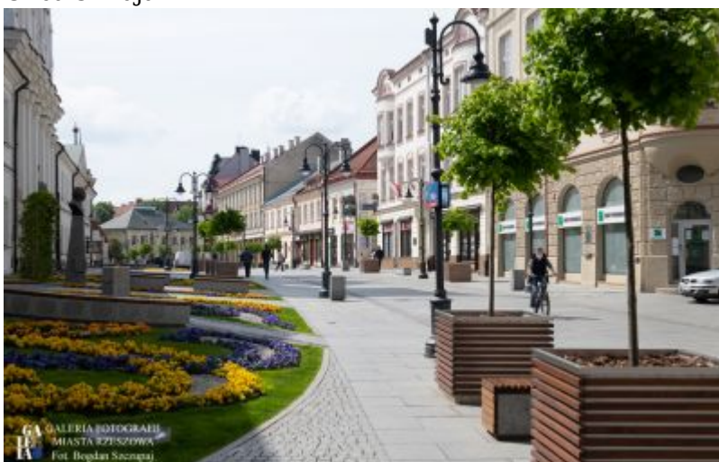
Ulica 3 Maja