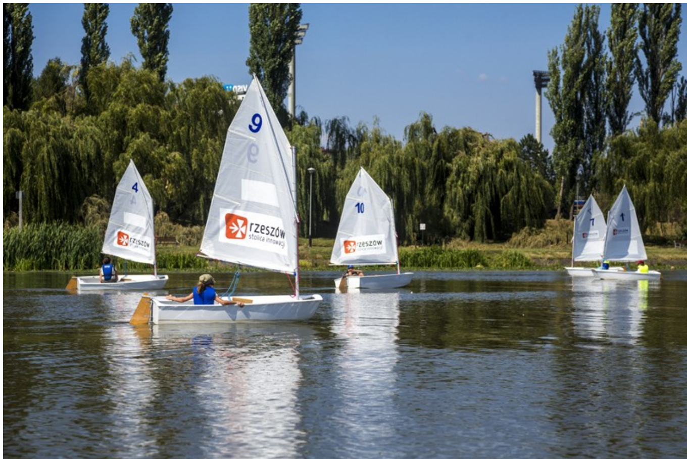
Łódki na zalewie