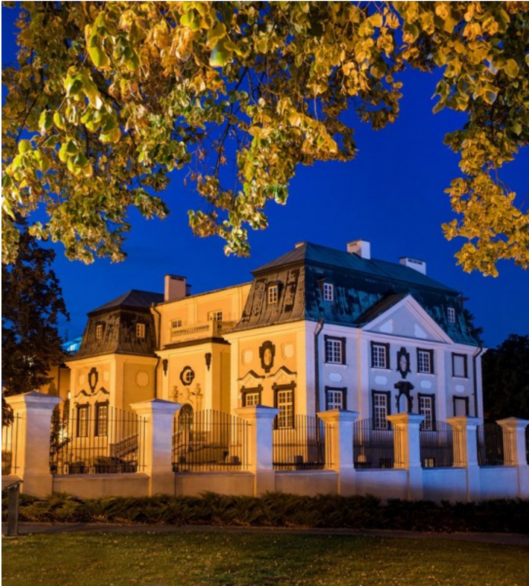
Letni pałacyk Lubomirskich