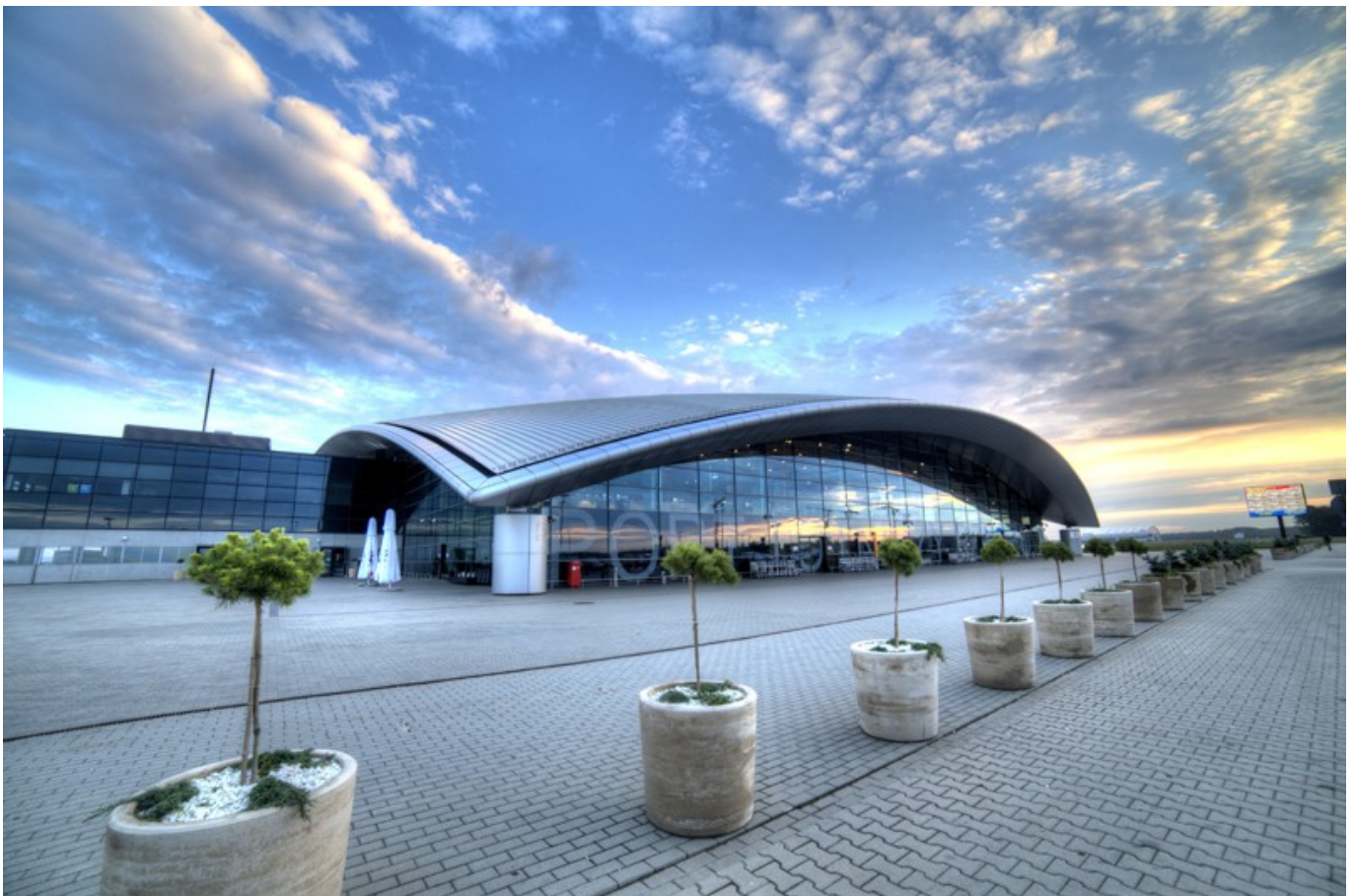
Port lotniczy Rzeszów - Jasionka