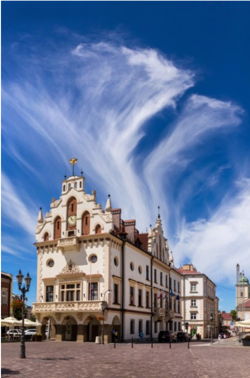
Ratusz - siedziba władz miasta