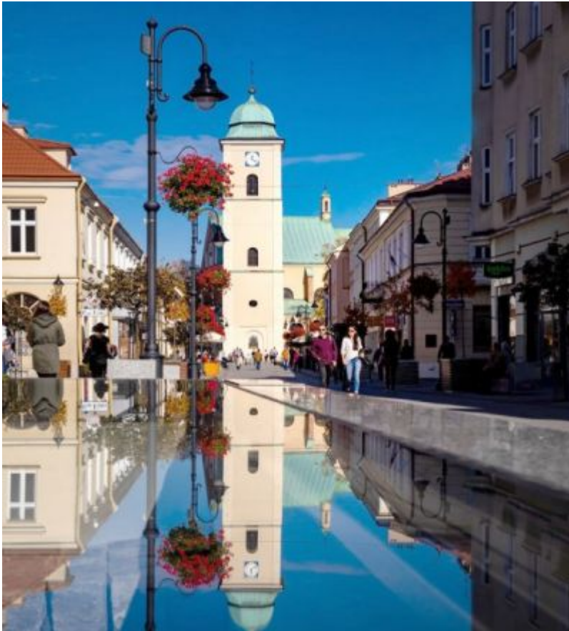
Ulica 3 Maja