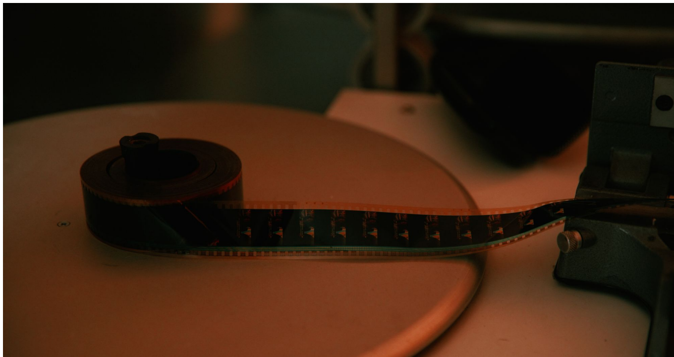
Kino "Zorza" ul. 3 Maja 28 w Rzeszowie