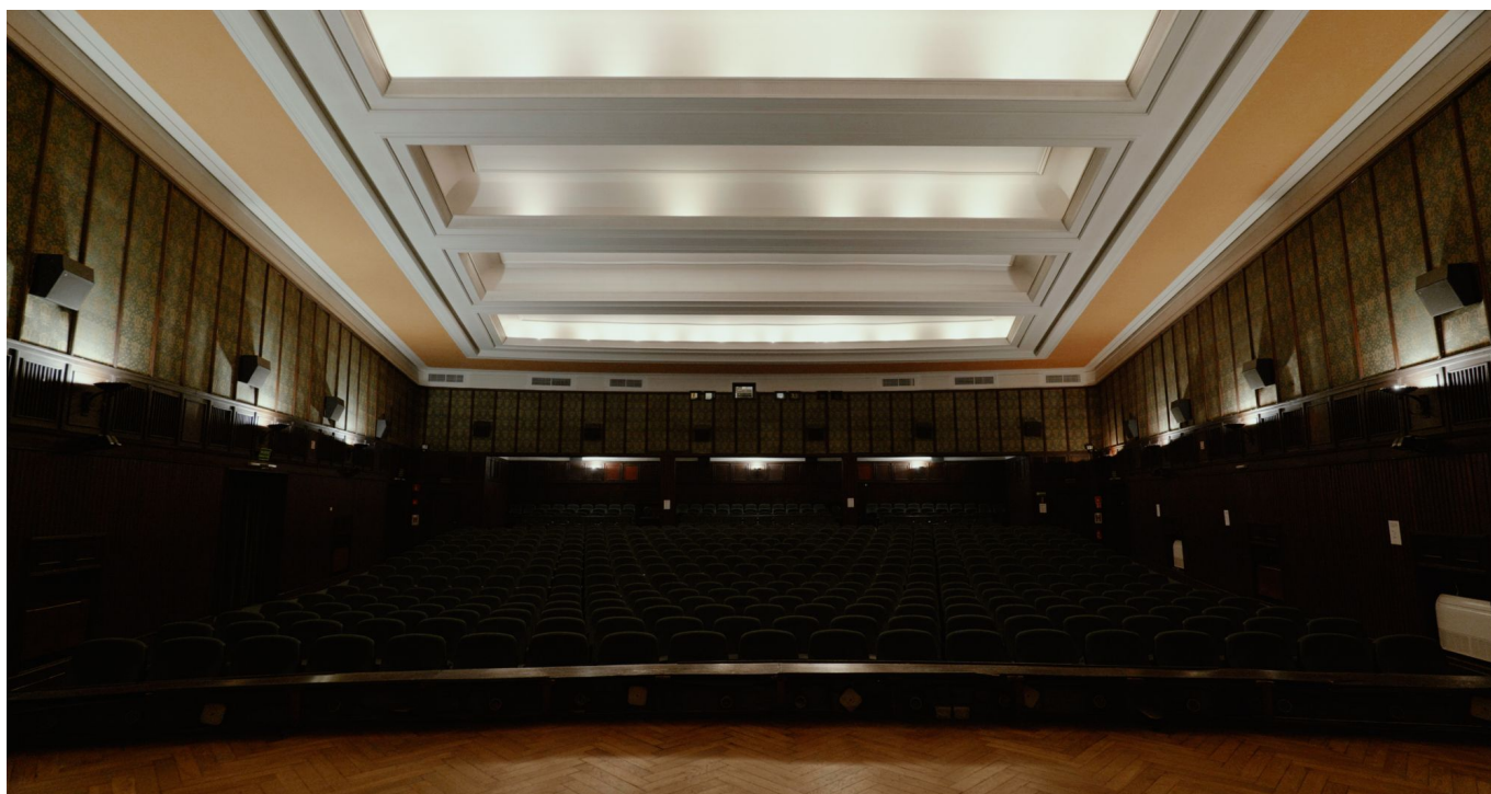
Kino "Zorza" ul. 3 Maja 28 w Rzeszowie