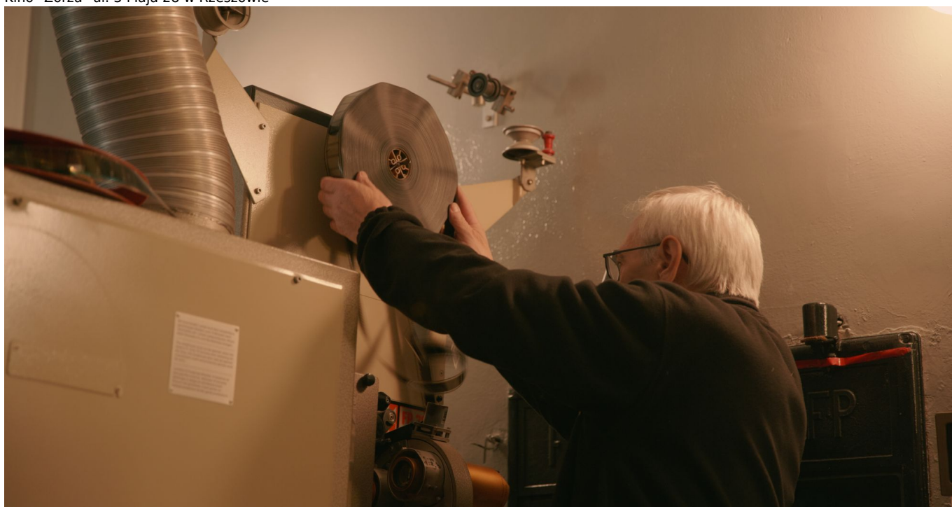
Kino "Zorza" ul. 3 Maja 28 w Rzeszowie