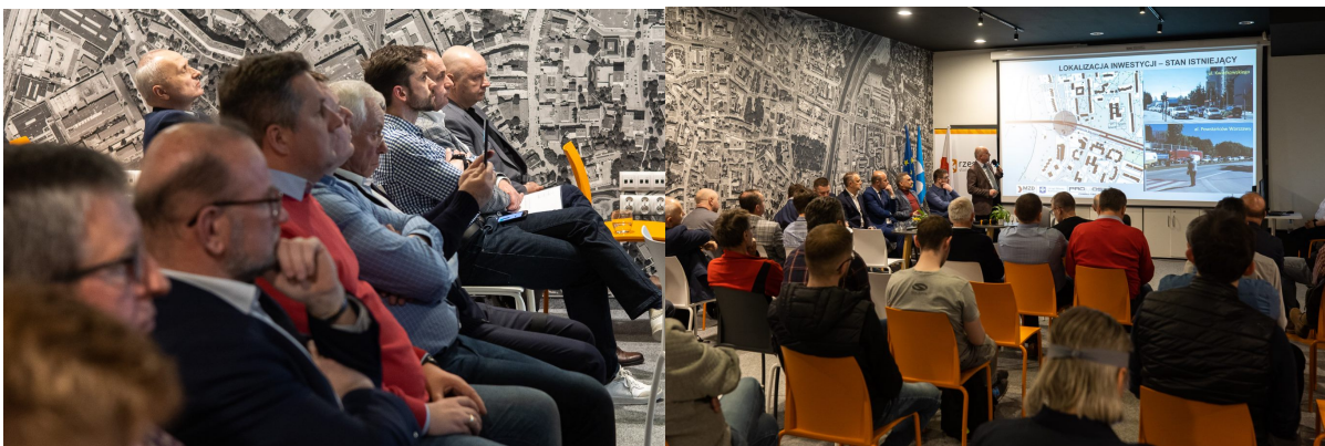
Wariant I ( W13)