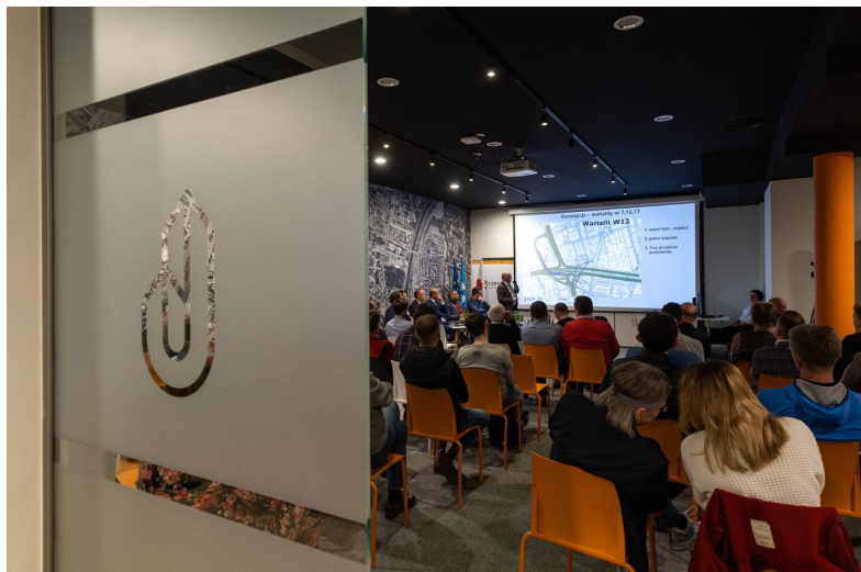
Konsultacje społeczne - budowa wiaduktu w Rzeszowie