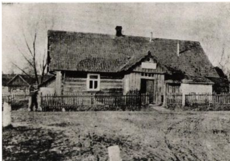
Spółdzielczość mleczarska w Galicji