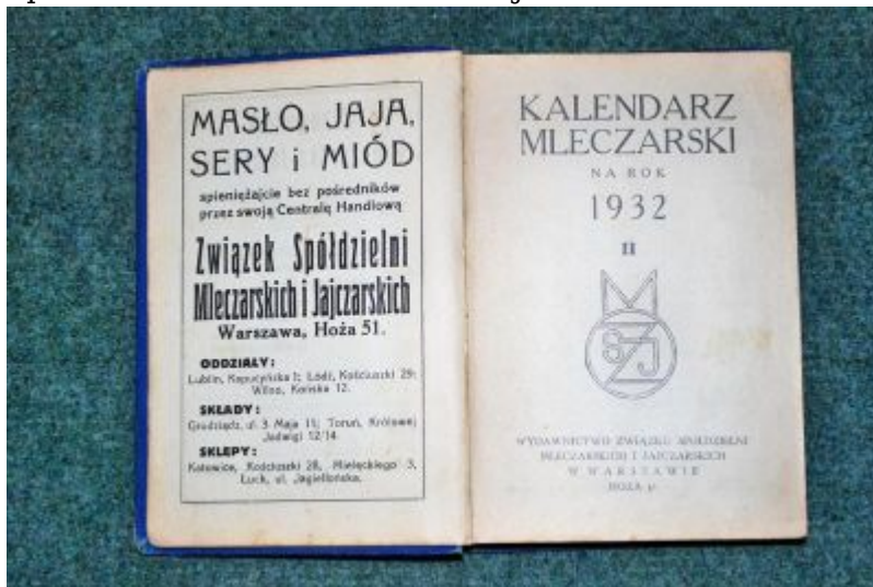
Wydawnictwo książkowe Związku Spółdzielni Mleczarskich i Jajczarskich