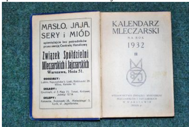
Wydawnictwo książkowe Związku Spółdzielni Mleczarskich i Jajczarskich