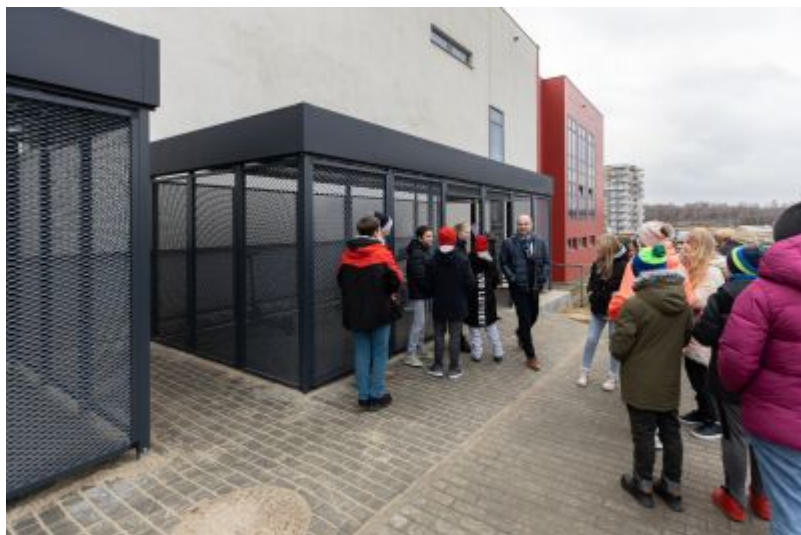
Wiąta rowerowa przy Szkole Podstawowej nr 18.