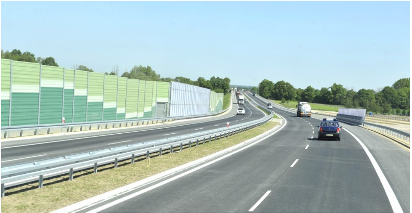
Łącznik do autostrady A4