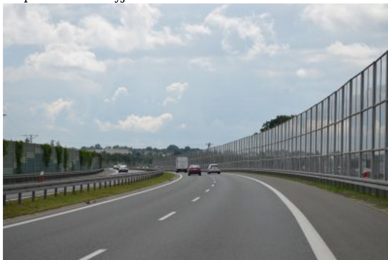
Droga krajowa łącząca obwodnicę północną miasta Rzeszowa z drogą...