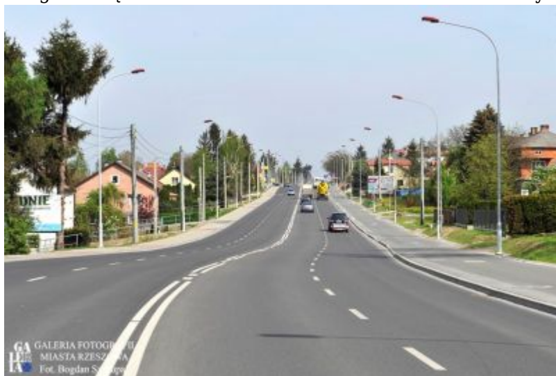
Ostatni rozbudowany odcinek ul. Sikorskiego