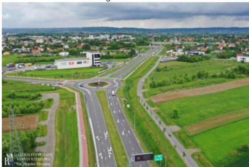
Droga od węzła Rzeszów Południe na drodze S19 do skrzyżowania z ul. Podkarpacką