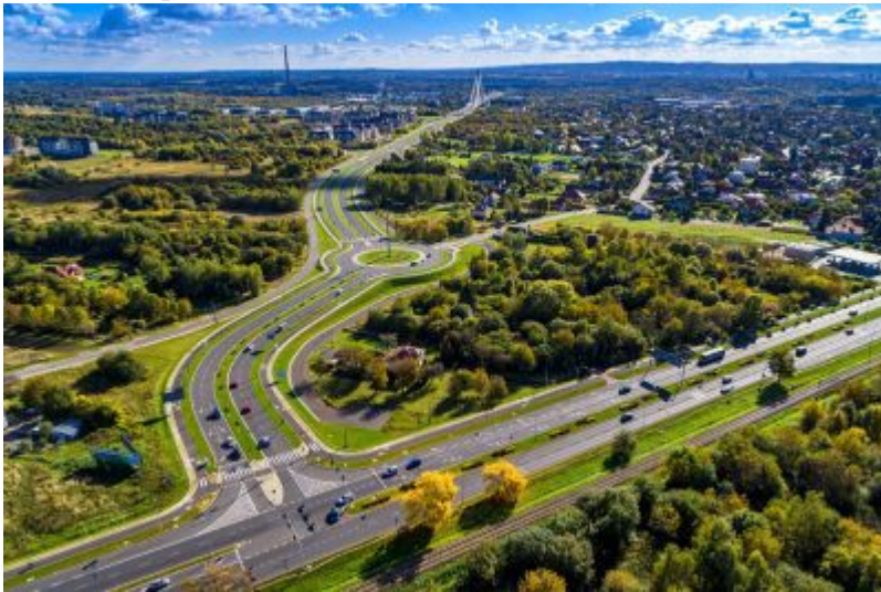
Droga łącząca ul. Lubelską z Warszawską, fot. Tadeusz Poźniak

Ogromnym atutem Rzeszowa jest dogodne położenie na transeuropejskich szlakach komunikacyjnych. Tu krzyżują się: międzynarodowa trasa E-40 Drezno - Kijów oraz drogi krajowe nr 9 i 19, umożliwiające najkrótsze połączenie krajów skandynawskich i nadbałtyckich z państwami Europy Środkowo-Wschodniej. Przez Rzeszów prowadzi również magistrala kolejowa E-30, mająca międzynarodowe znaczenie gospodarcze.