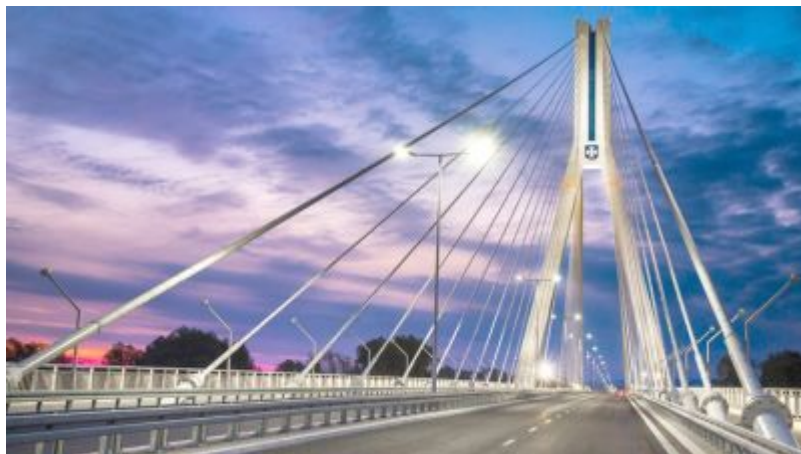
Most im. T. Mazowieckiego