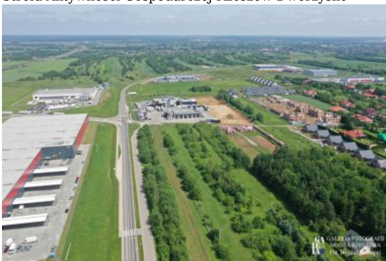
Strefa Aktywności Gospodarczej Rzeszów-Dworzysko