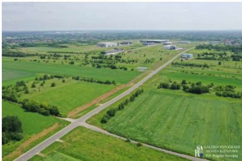
Strefa Aktywności Gospodarczej Rzeszów-Dworzysko

Miasto Rzeszów zachęca przedsiębiorców do inwestowania w stolicy Podkarpacia, oferując atrakcyjne tereny inwestycyjne położone w północno-zachodniej części Rzeszowa, objęte oddziaływaniem Strefy Aktywności Gospodarczej Rzeszów-Dworzysko. W skład Strefy wchodzi, Podstrefa Rzeszów Specjalnej Strefy Ekonomicznej „EURO-PARK MIELEC”, z lokalizacjami na Osiedlach Przybyszówka i Miłocin, oraz tereny inwestycyjne położone w ich bezpośrednim sąsiedztwie.