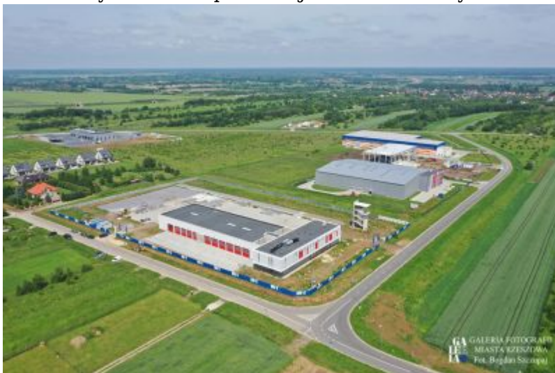
Strefa Aktywności Gospodarczej Rzeszów-Dworzysko