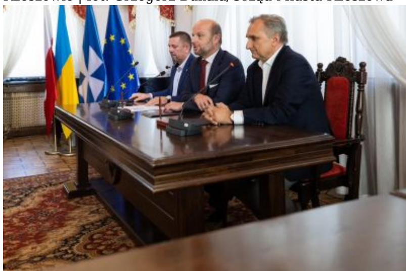
Zdjęcie ilustrujące podpisanie umowy na dokumentację przebudowy dróg na os. Budziwój w Rzeszowie

- Dzięki podpisanej dziś umowie rozpoczyna się projektowanie jednej z ważniejszych arterii