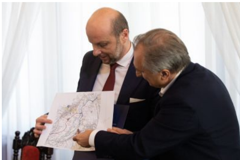
Zdjęcie ilustrujące podpisanie umowy na dokumentację przebudowy dróg na os. Budziwój w Rzeszowie | fot. Grzegorz Bukała/Urząd Miasta Rzeszowa