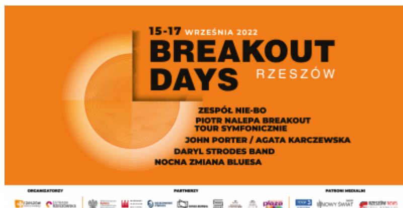
Grafika promująca Breakout Days