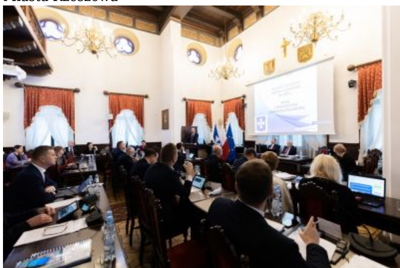
Obrady listopadowej sesji Rady Miasta, fot. Grzegorz Bukała/Urząd Miasta Rzeszowa

Ponad 1,76 mld zł ma wynieść przyszłoroczny budżet Rzeszowa. Podczas dzisiejszej sesji rady miasta