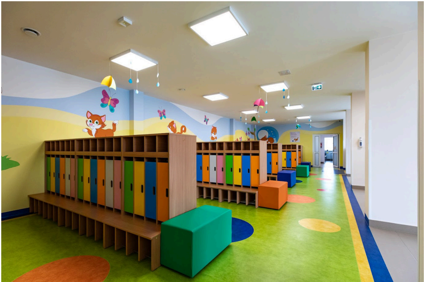
Wnętrze budynku - szatnia, fot. Grzegorz Bukała/Urząd Miasta Rzeszowa

W środę, 1 września, ponad 350 maluchów pojawiło się w nowym żłobku i przedszkolu, które powstały przy ul. Iwonickiej w Rzeszowie. Obydwie inwestycje kosztowały łącznie ponad 17 mln zł.