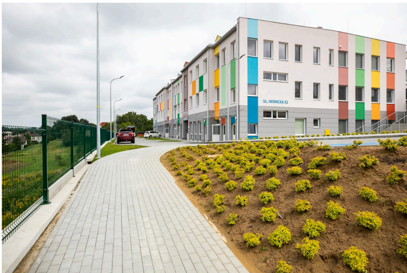
Budynek żłobka i przedszkola ul. Iwonickiej, fot. Grzegorz Bukała/Urząd Miasta Rzeszowa