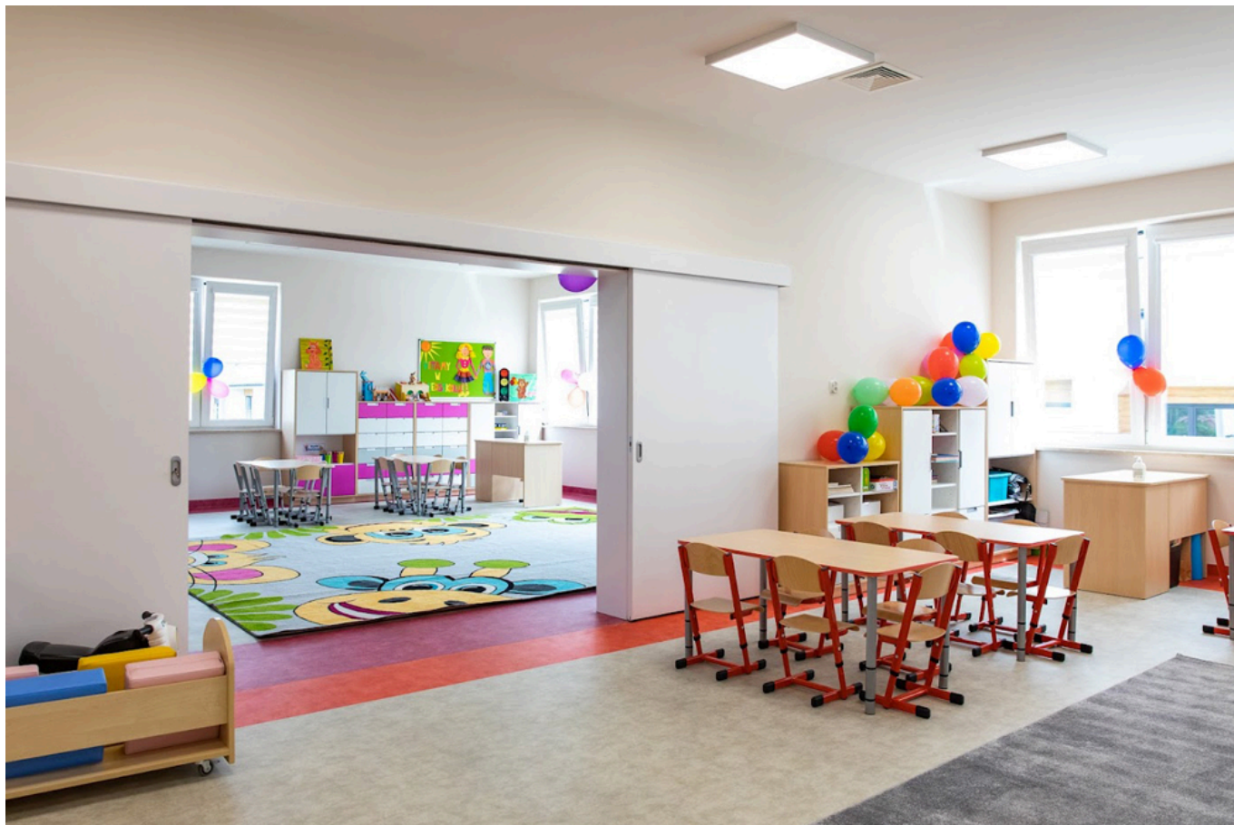
Wnętrza budynku - sala oddziałowa