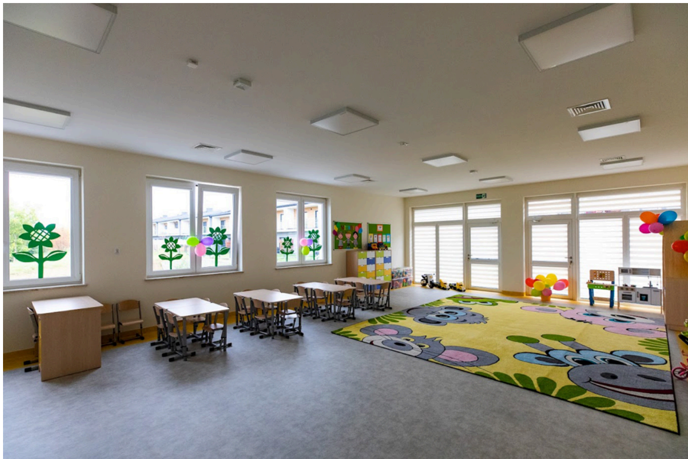
Wnętrza budynku - sala oddziałowa, fot. Grzegorz Bukala/Urząd Miasta Rzeszowa