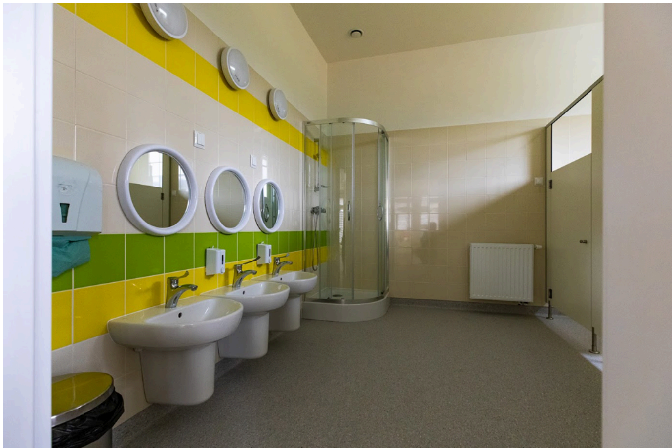
Wnętrza budynku - łazienka, fot. Grzegorz Bukała/Urząd Miasta Rzeszowa