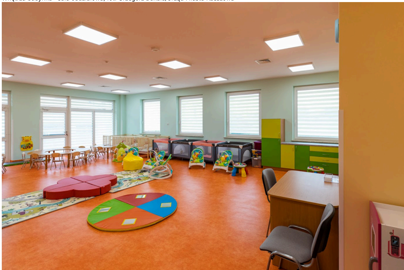
Wnętrza budynku - sala oddziałowa