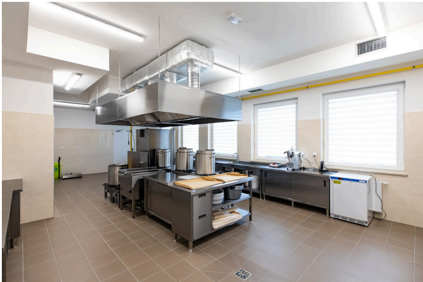
Wnętrza budynku - kuchnia