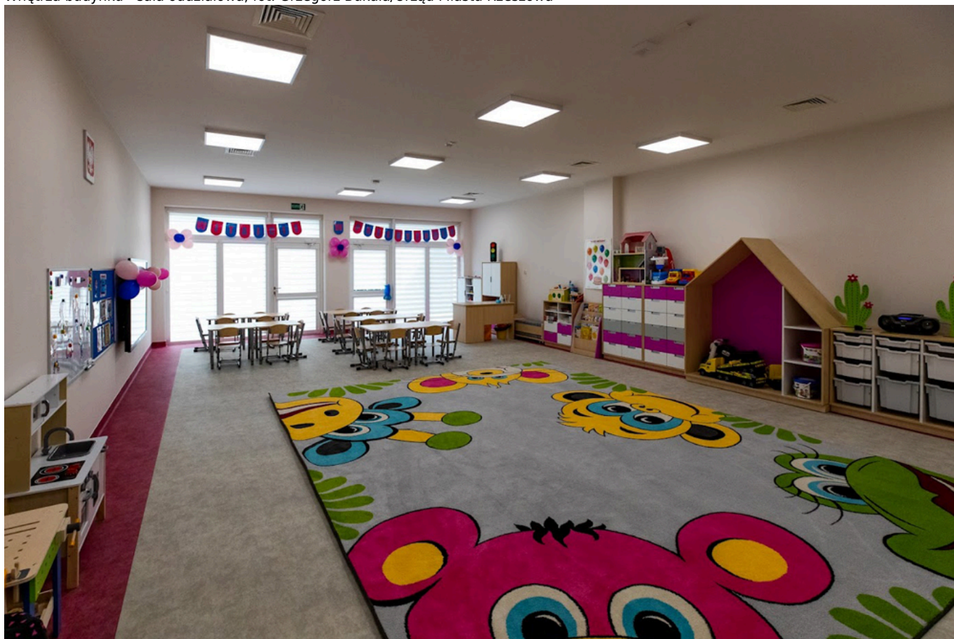
Wnętrza budynku - sala oddziałowa