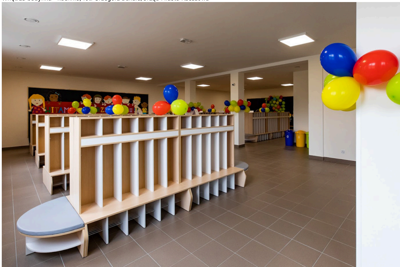
Wnętrza budynku - szatnia