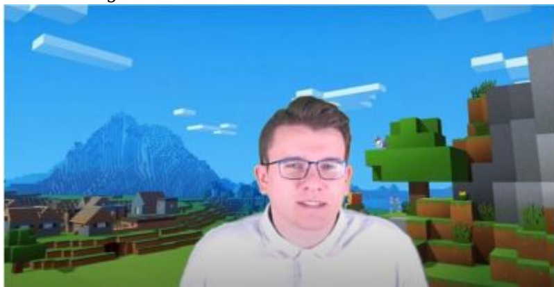
Szkoła z Gigantami