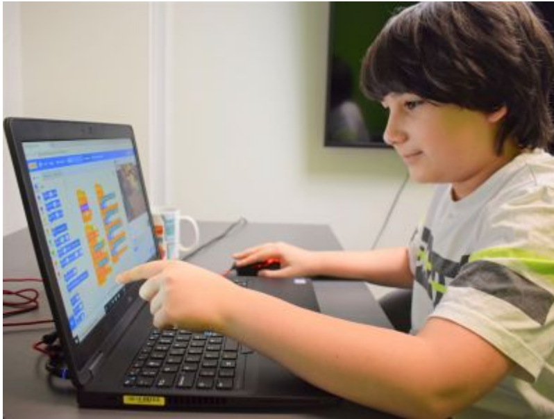
Szkoła z Gigantami