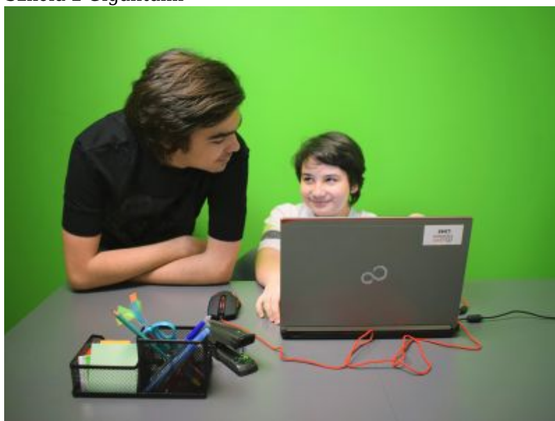
Szkoła z Gigantami