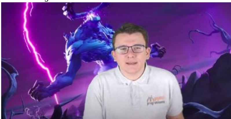
Szkoła z Gigantami