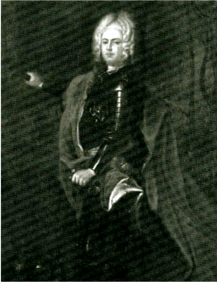
Jerzy Ignacy Lubomirski