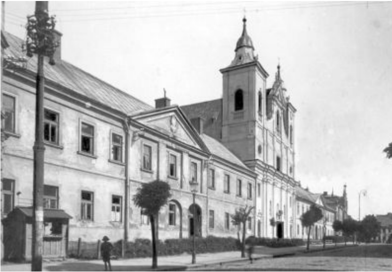
Gimnazjum rzeszowskie w okresie międzywojennym.