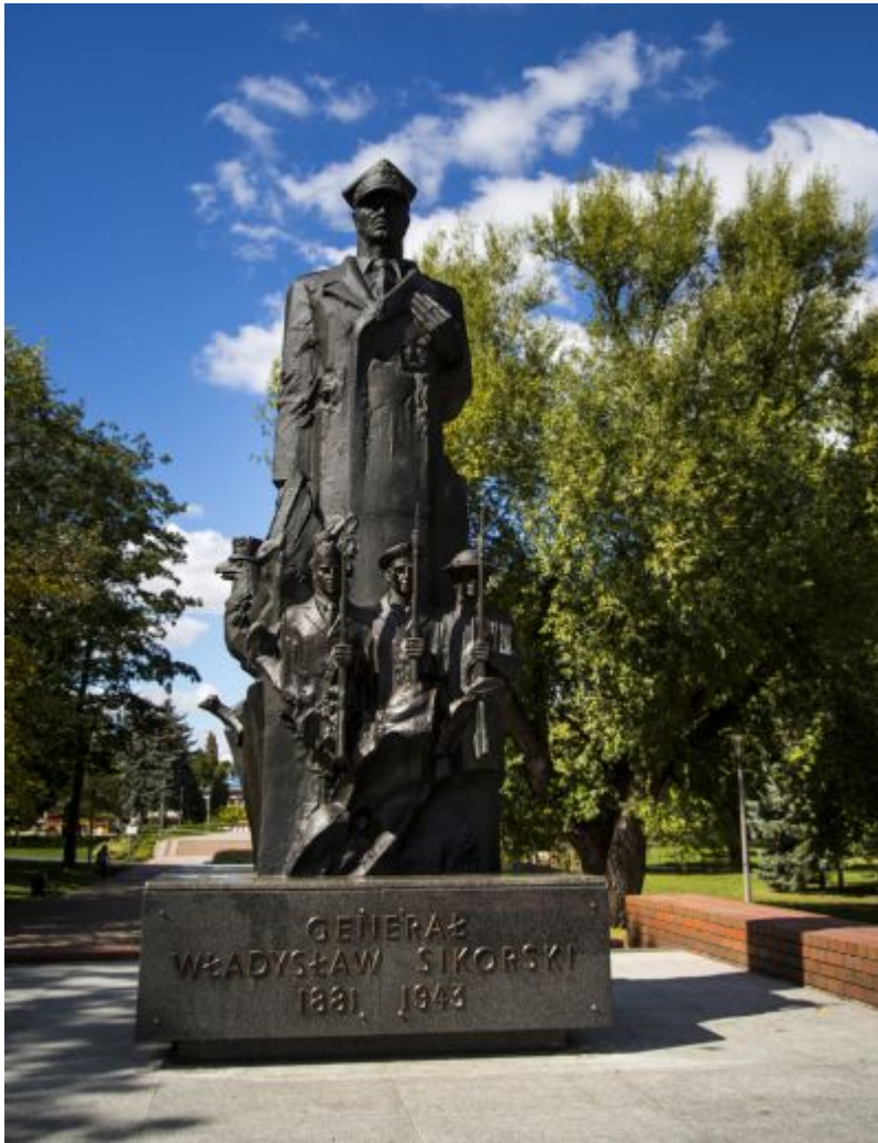
Pomnik gen. Władysława Sikorskiego w parku Jedności Polonii z Macierzą