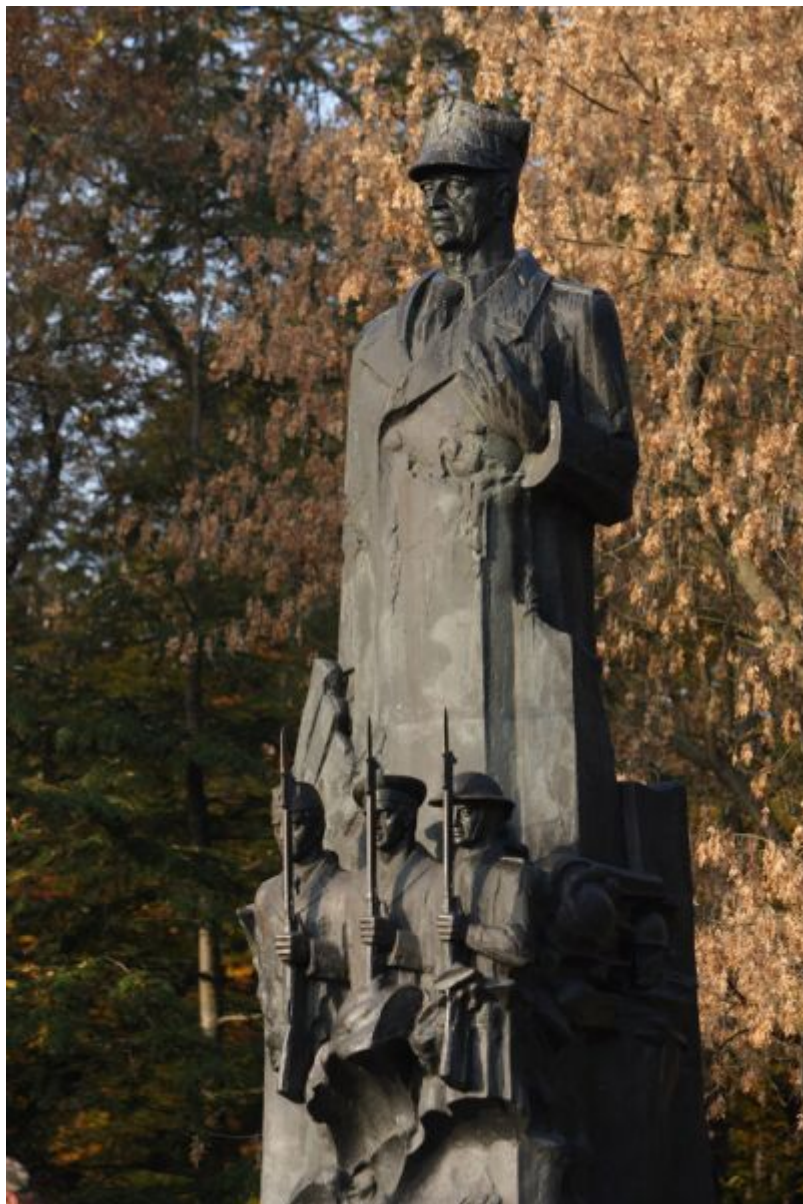
Pomnik gen. Władysława Sikorskiego w parku Jedności Polonii z Macierzą