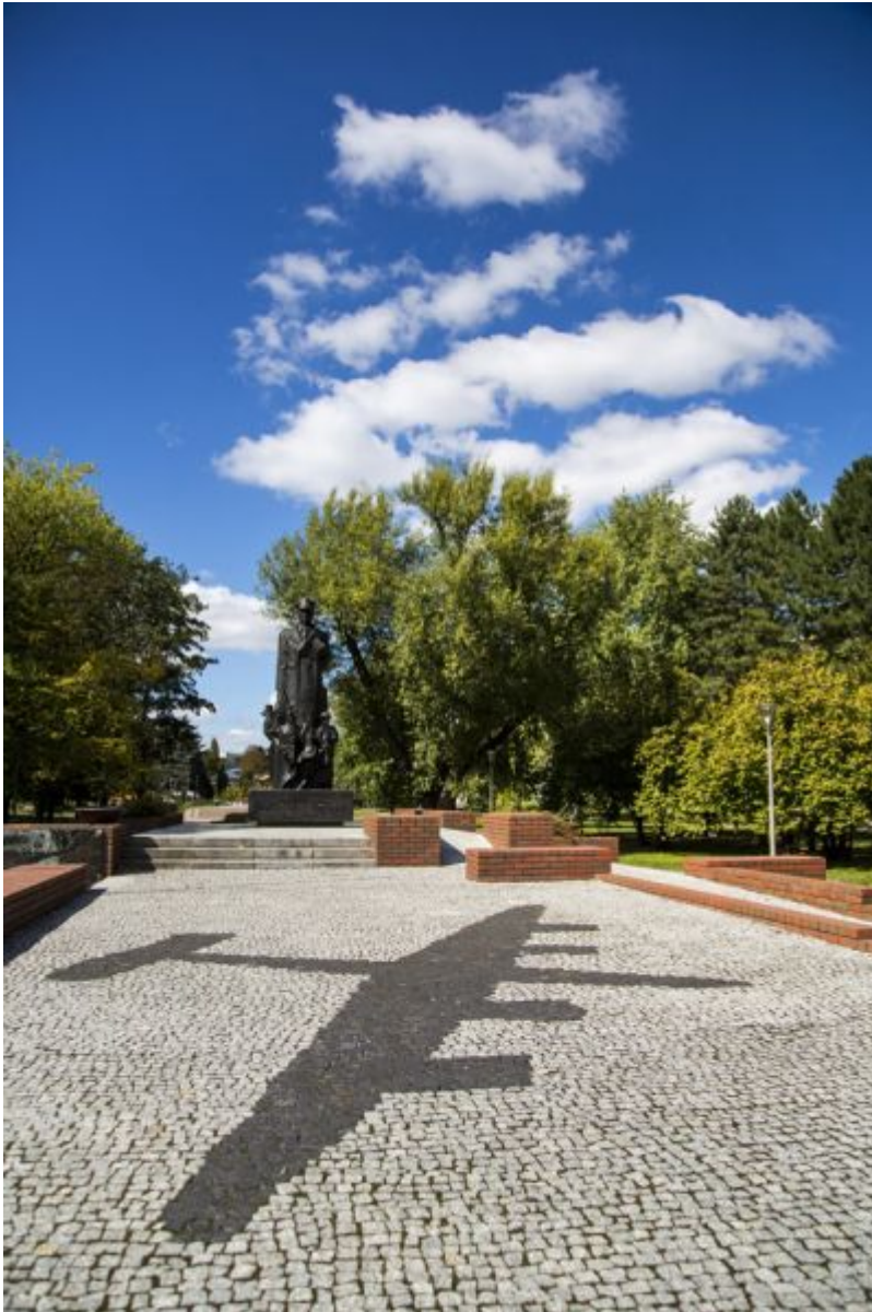
Pomnik gen. Władysława Sikorskiego w parku Jedności Polonii z Macierzą