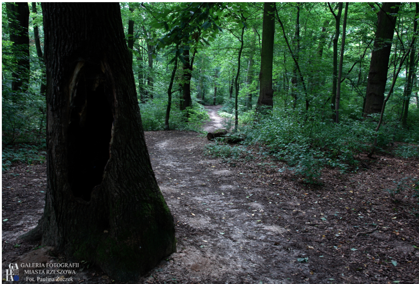
Park na Lisiej Górze