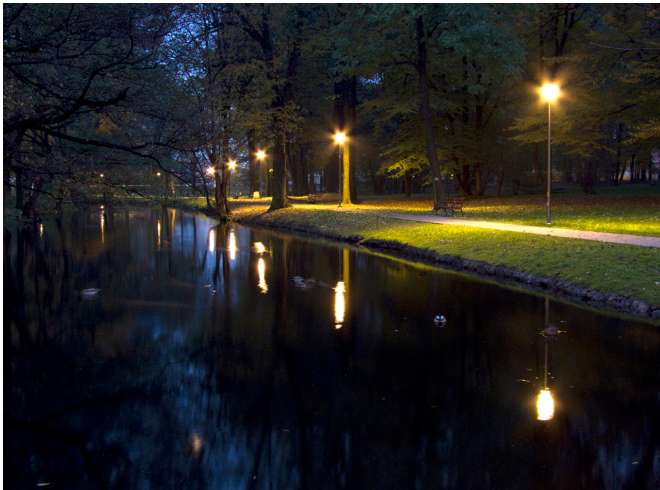
Park w zespole dworsko-parkowym w Słocinie

Położony we wschodniej części miasta, na stoku Pogórza Dynowskiego w dolinie potoku Młynówka. Powstał w XIX w. jako założenie dworsko-pałacowe o powierzchni ok. 6 ha. Majątek dworski w Słocinie stanowił w końcu XVII i w XVIII w. własność rodu Branickich. Przez długi okres w XIX w. majątek w Słocinie był własnością Maurycyego Korwin-Szymanowskiego i jego żony Anny z Zawiskich. Zapewne z jego inicjatywy w 3 ćwierci XIX w. przebudowano wcześniej istniejący dwór oraz zespół dworski. Po Szymanowskich majątek w Słocinie przechodził kolejno w ręce: Zofii Wallis (córci Szymanowskich), Brunickich oraz Chłapowskich.