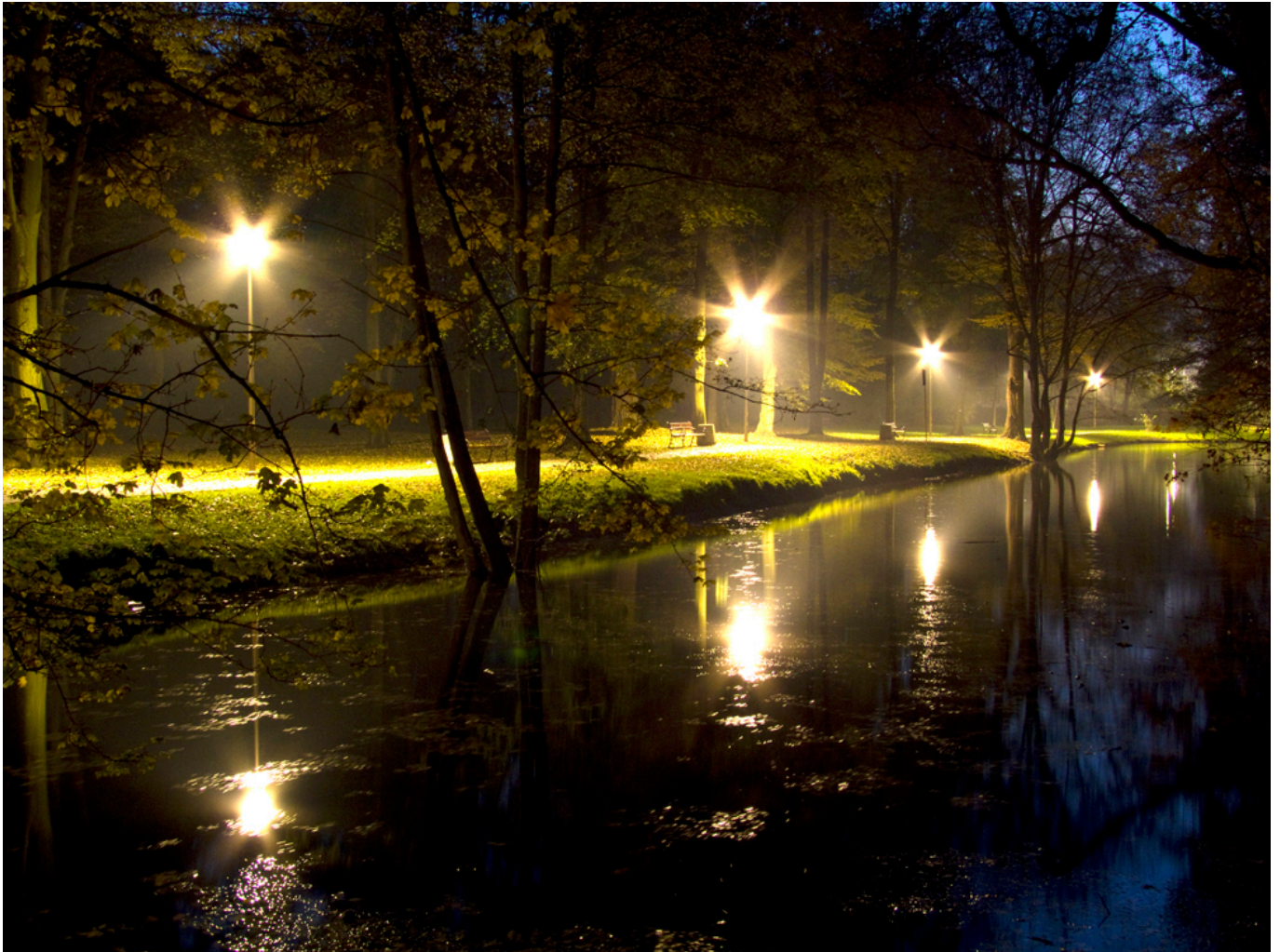
Park w zespole dworsko-parkowym w Słocinie