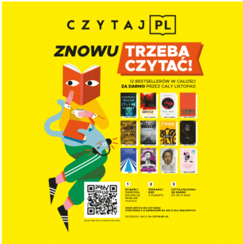
Plakat Czytaj PL