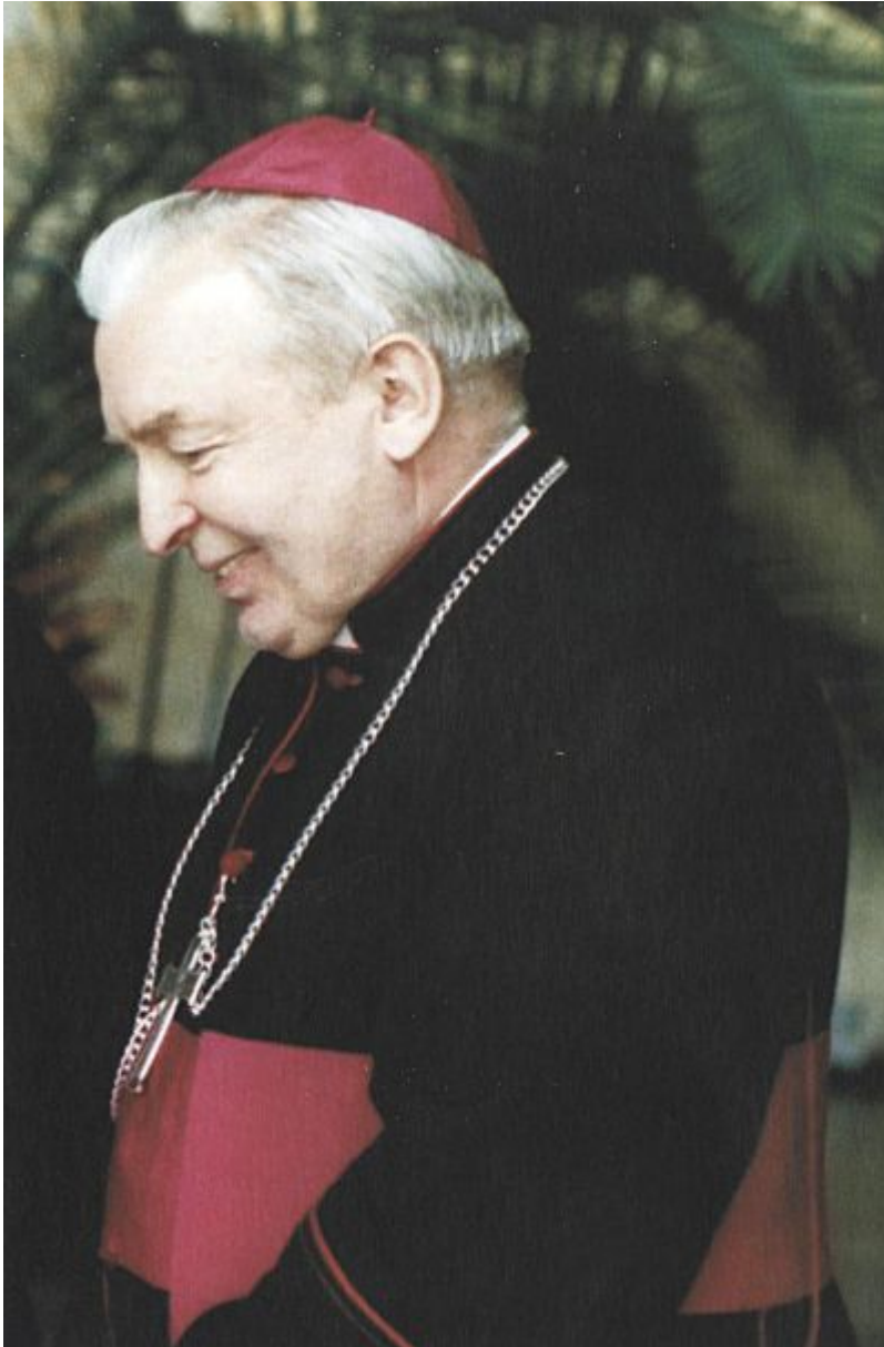
Ksiądz Biskup Kazimierz Górny