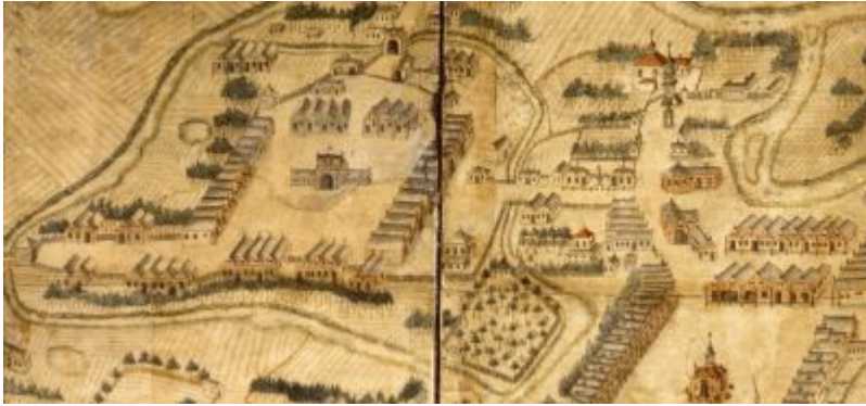
Fragm. planu Wiedemanna, z widokiem na dzielnicę żydowską, synagogi i dwa cmentarze żydowskie