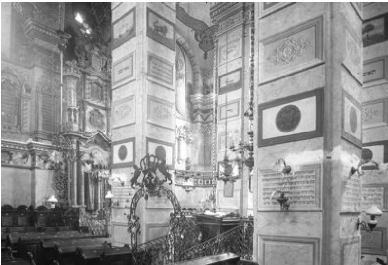
przedst. wnętrze Synagogi Staromiejskiej, widok na podpory bimy.