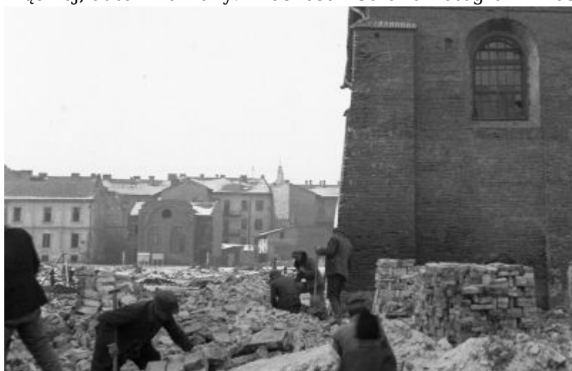
Fot. z czasów okupacji z widokiem na synagogę Klaus Sąddecki (ul. Wąska 3)