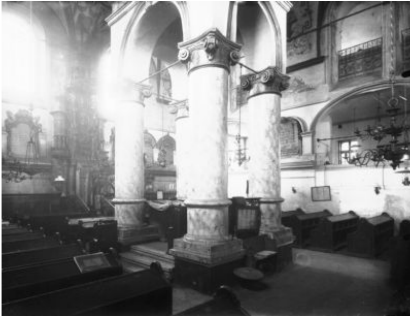
Fot. Edwarda Janusza przedst. wnętrze Synagogi Staromiejskiej, widok na bime. Galeria Fotografii Miasta Rzeszowa