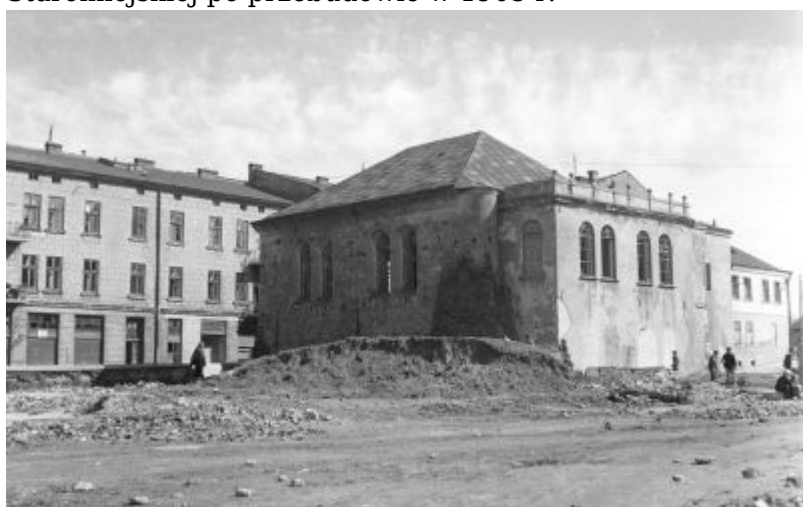
Fot. z czasów okupacji z widokiem na Synagogę Staromiejską, wykonana z perspektywy cmentarza żydowskiego.