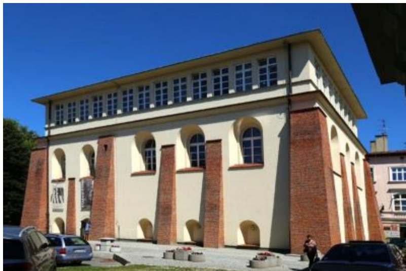
Synagoga Nowomiejska, widok współczesny.

Jednym z materialnych dowodów na historyczną wielokulturowość naszego miasta są dwie zachowane synagogi – Staromiejska stanowiąca obecnie siedzibę Archiwum Państwowego oraz Nowomiejska mieszcząca Biuro Wystaw Artystycznych.