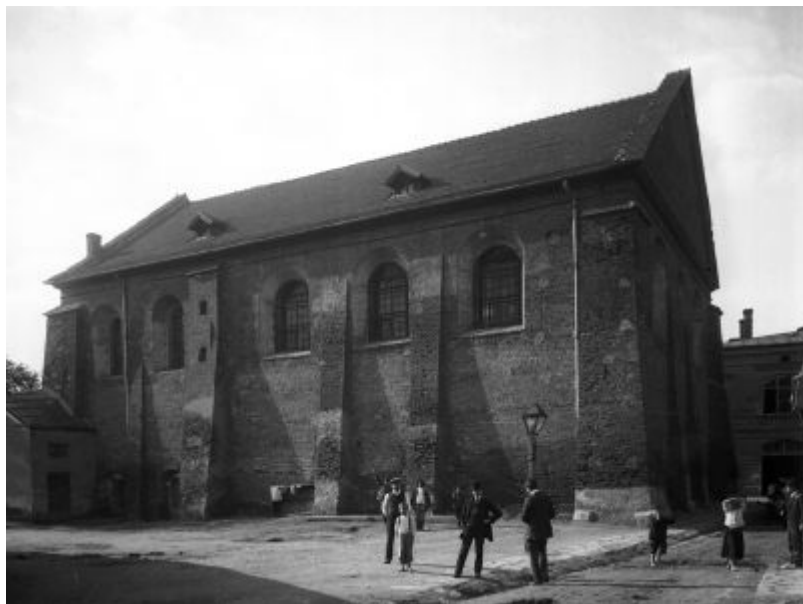
Fot. z czasów okupacji z widokiem na Synagogę Nowomiejską, wykonana z perspektywy ul. Bozniczej.