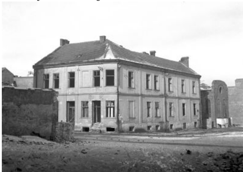
Fot. z czasów okupacji z widokiem na synagogę Klaus Sąddecki, ukazująca róg ul. Kopernika i Wąskiej, autor nieznany. Własność - Galeria Fotografii Miasta Rzeszowa