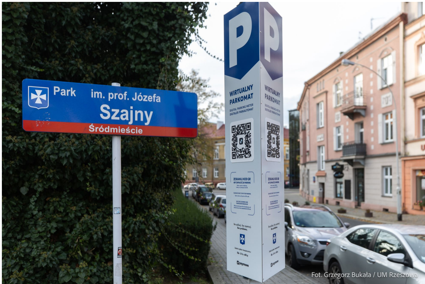
System płatności parkingowych Paymove