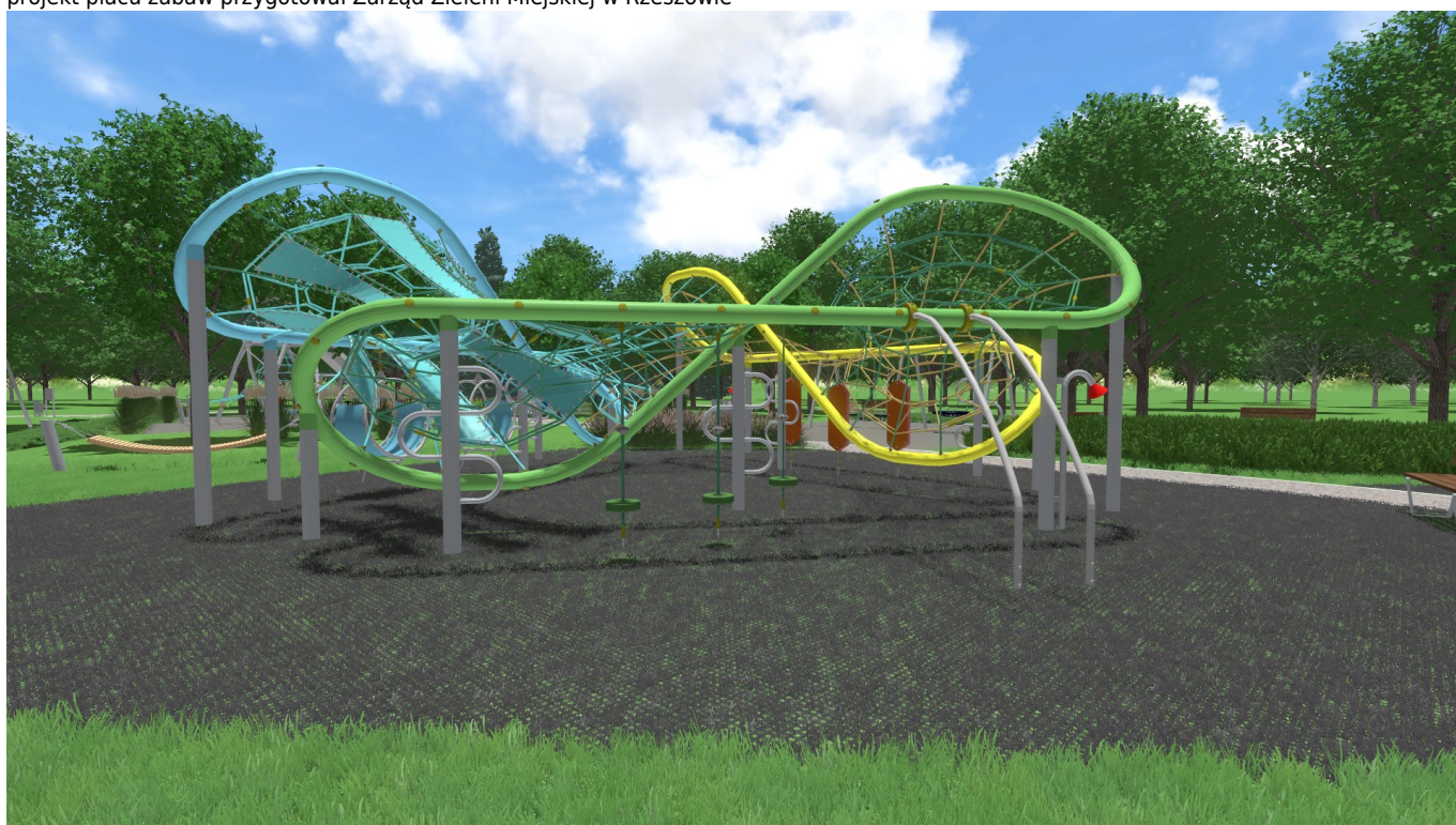
projekt placu zabaw przygotował Zarząd Zieleni Miejskiej w Rzeszowie