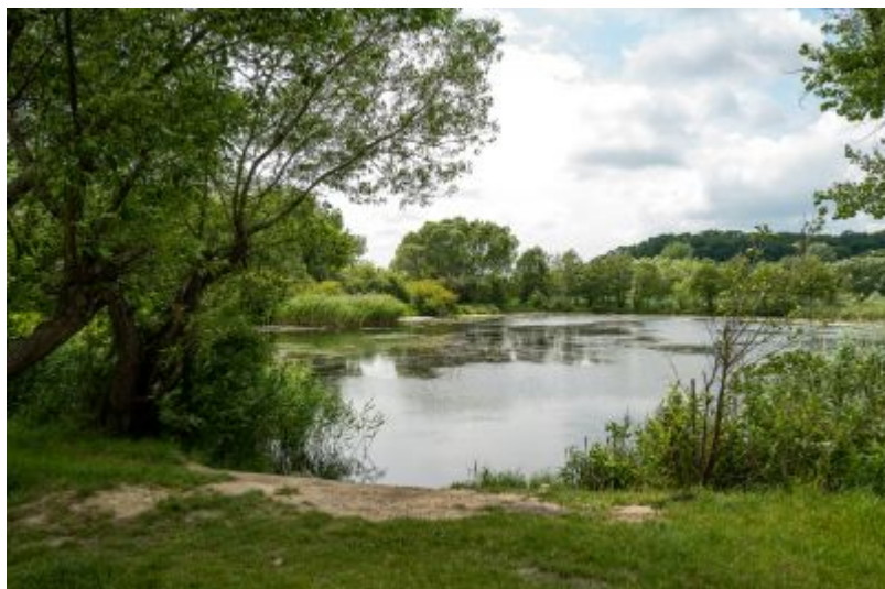
zdjęcie rzeszowskiego Wisłoka, fot. Grzegorz Bukała, Urząd Miasta Rzeszowa