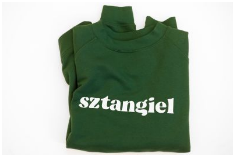
bluza z napisem gwary rzeszowskiej

Już w tę niedzielę Finał Wielkiej Orkiestry Świątecznej Pomocy. Na rzeszowskich ulicach pojawią się wolontariusze z 4 sztabów. W tę piękną akcję włącza się tradycyjnie Prezydent Rzeszowa, Konrad Fijołek: - Zawsze uczestniczę w WOŚP-owym graniu. To fantastyczna, energetyzująca impreza, której przyświeca szczytny cel. Razem możemy zrobić więcej. Zapraszam wszystkich na rzeszowski Finał i do licytowania moich aukcji, a będzie to wyjątkowa bluza i rejs po Wisłoku.