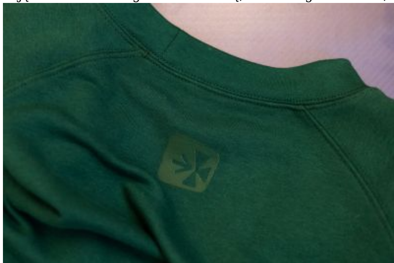
bluza rzeszowska, fot. Grzegorz Bukała, Urząd Miasta Rzeszowa