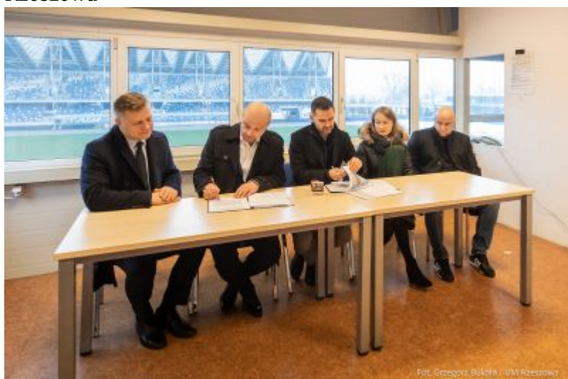
zdjęcie z obiektu spikerki na Stadionie Miejskim "Stal"