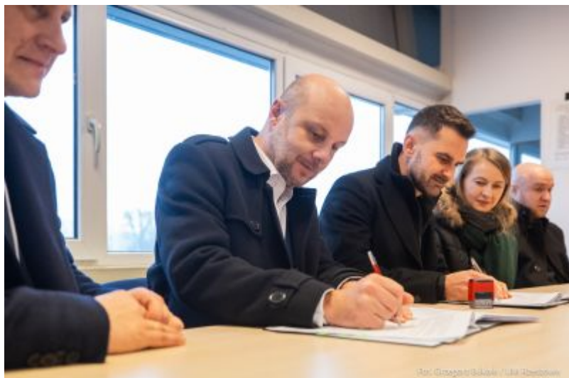
zdjęcie z obiektu spikerki na Stadionie Miejskim "Stal"