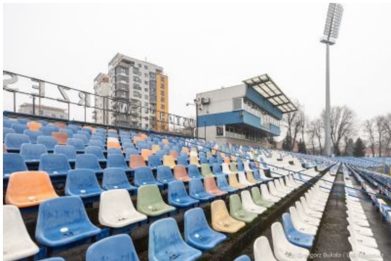
zdjęcie z obiektu spikerki na Stadionie Miejskim "Stal"