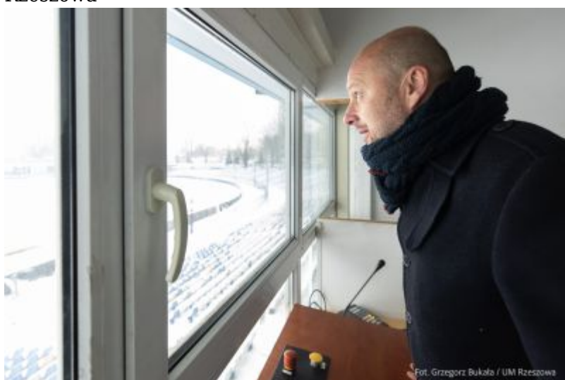
zdjęcie z obiektu spikerki na Stadionie Miejskim "Stal"