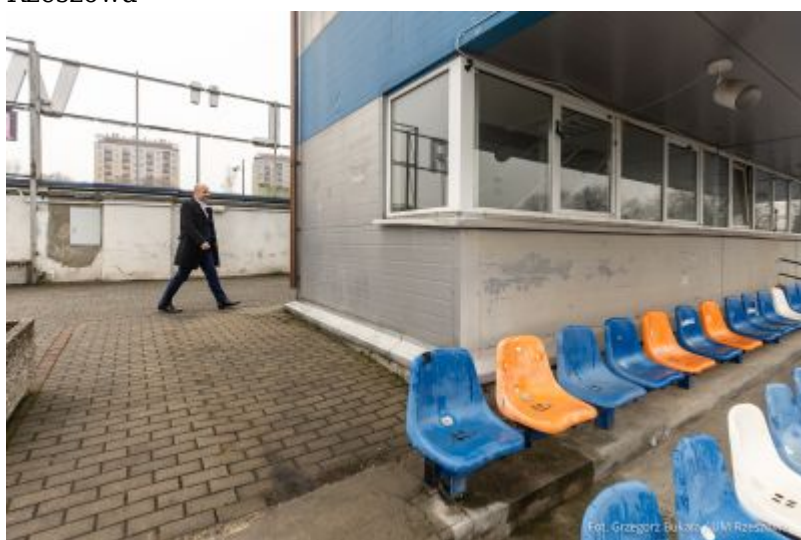
zdjęcie z obiektu spikerki na Stadionie Miejskim "Stal"