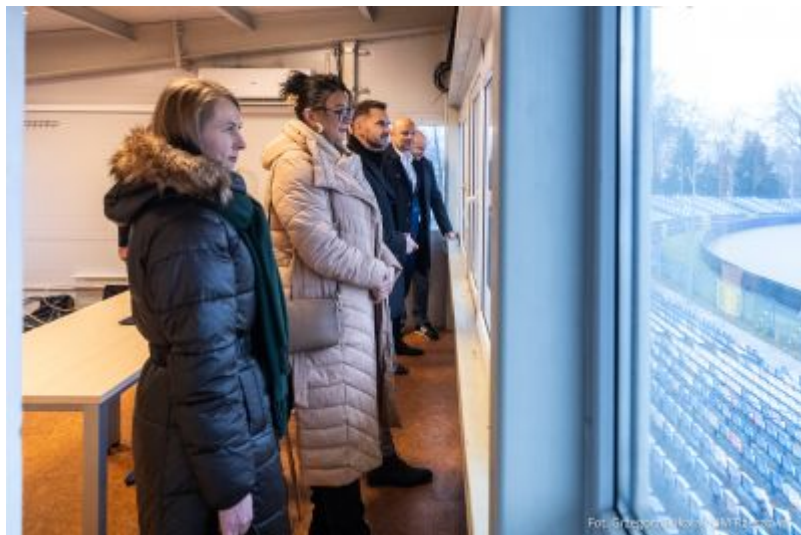
zdjęcie z obiektu spikerki na Stadionie Miejskim "Stal", fot. Grzegorz Bukała, Urząd Miasta Rzeszowa