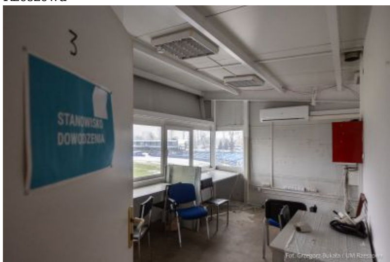
zdjęcie z obiektu spikerki na Stadionie Miejskim "Stal"

W środę podpisana została umowa z wykonawcą modernizacji obiektu spikerki na Stadionie Miejskim „Stal”. Ta inwestycja musi być zrealizowana, aby kluby korzystające ze stadionu przy ul. Hetmańskiej spełniły warunki licencyjne do organizacji rozgrywek sportowych.