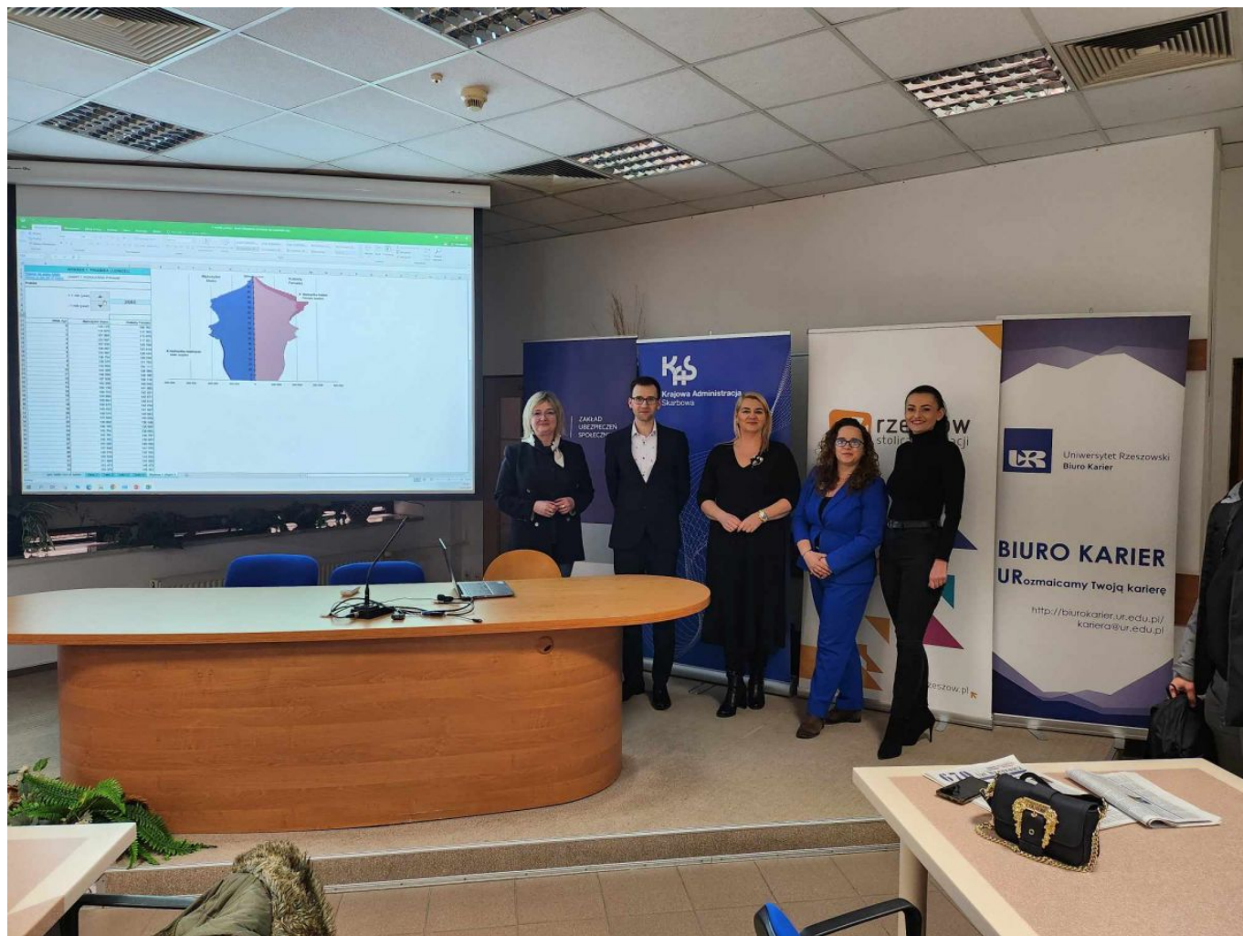
zdjęcie ze spotkania pracowników Biura Ewidencji Działalności Gospodarczej i Zezwoleń, Krajowej Administracji Skarbowej, Zakładu Ubezpieczeń Społecznych ze studentami Uniwersytetu Rzeszowskiego