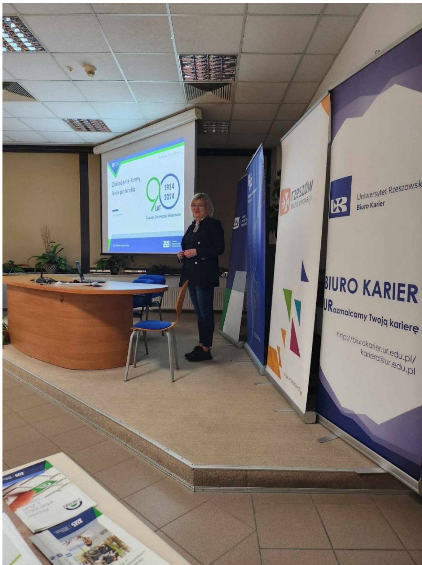
zdjęcie ze spotkania pracowników Biura Ewidencji Działalności Gospodarczej i Zezwoleń, Krajowej Administracji Skarbowej, Zakładu Ubezpieczeń Społecznych ze studentami Uniwersytetu Rzeszowskiego