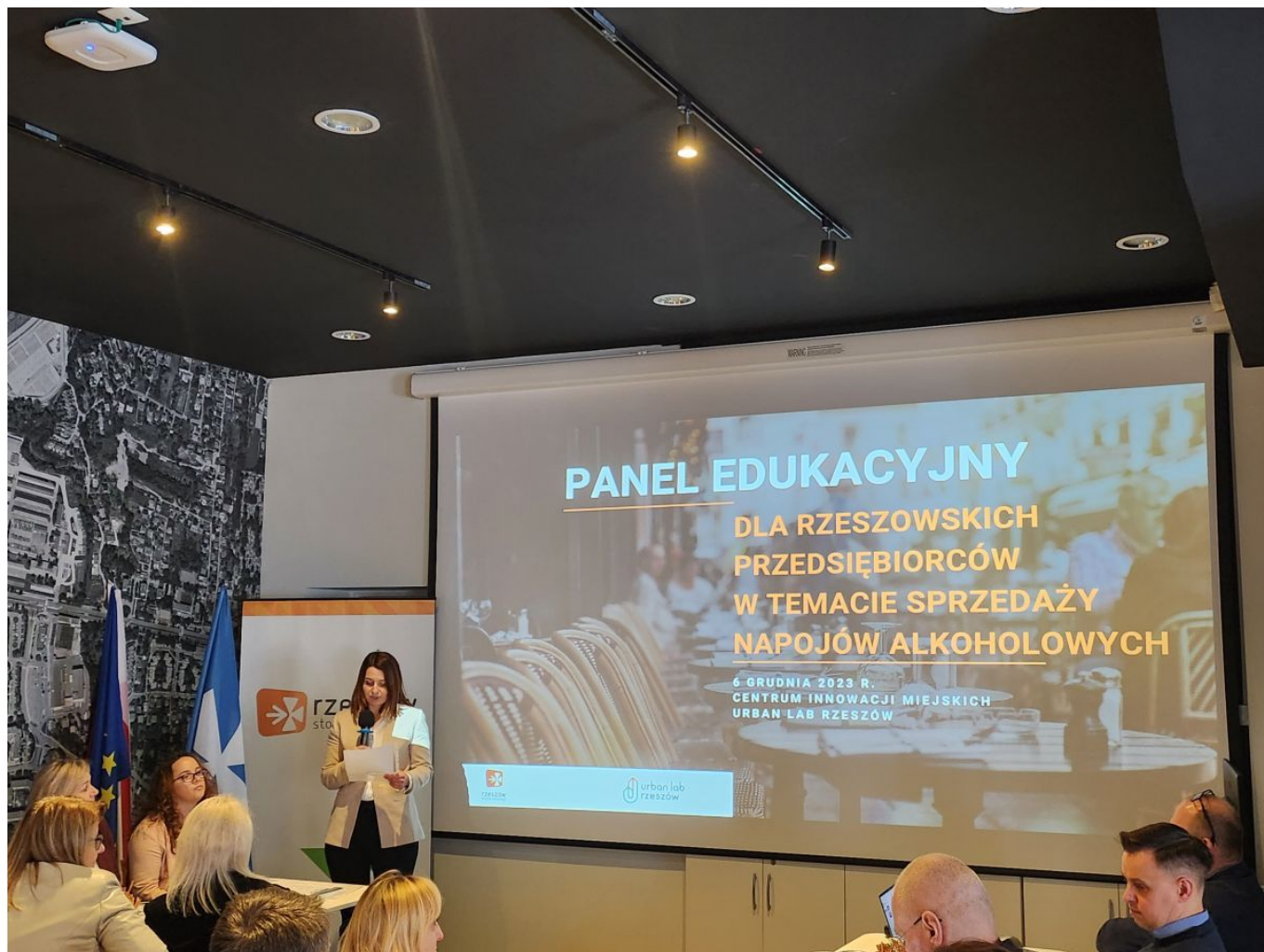
zdjęcie ze szkolenia z przedsiębiorcami na terenie miasta Rzeszowa, fot. Biuro Ewidencji Działalności Gospodarczej, Urząd Miasta Rzeszowa