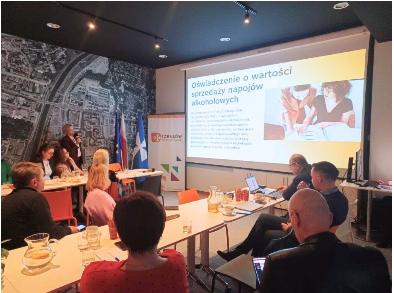
zdjęcie ze szkolenia z przedsiębiorcami na terenie miasta Rzeszowa, fot. Biuro Ewidencji Działalności Gospodarczej, Urząd Miasta Rzeszowa