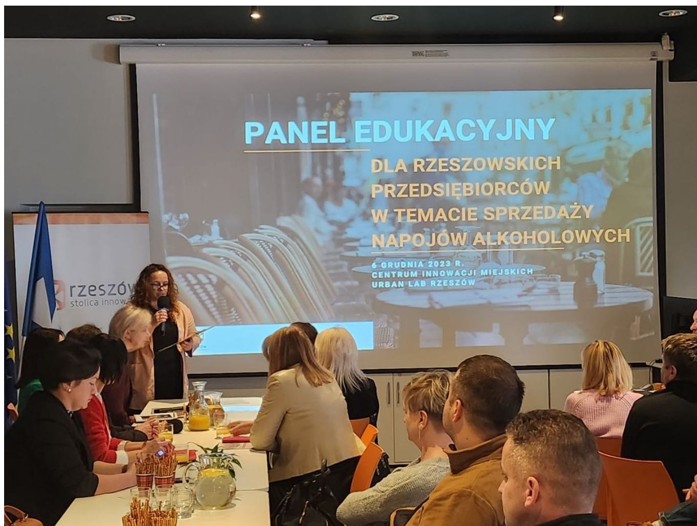
zdjęcie ze szkolenia z przedsiębiorcami na terenie miasta Rzeszowa