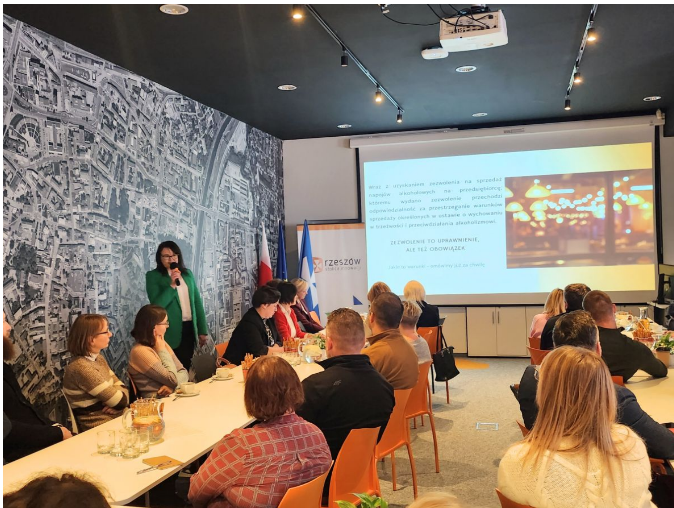
zdjęcie ze szkolenia z przedsiębiorcami na terenie miasta Rzeszowa