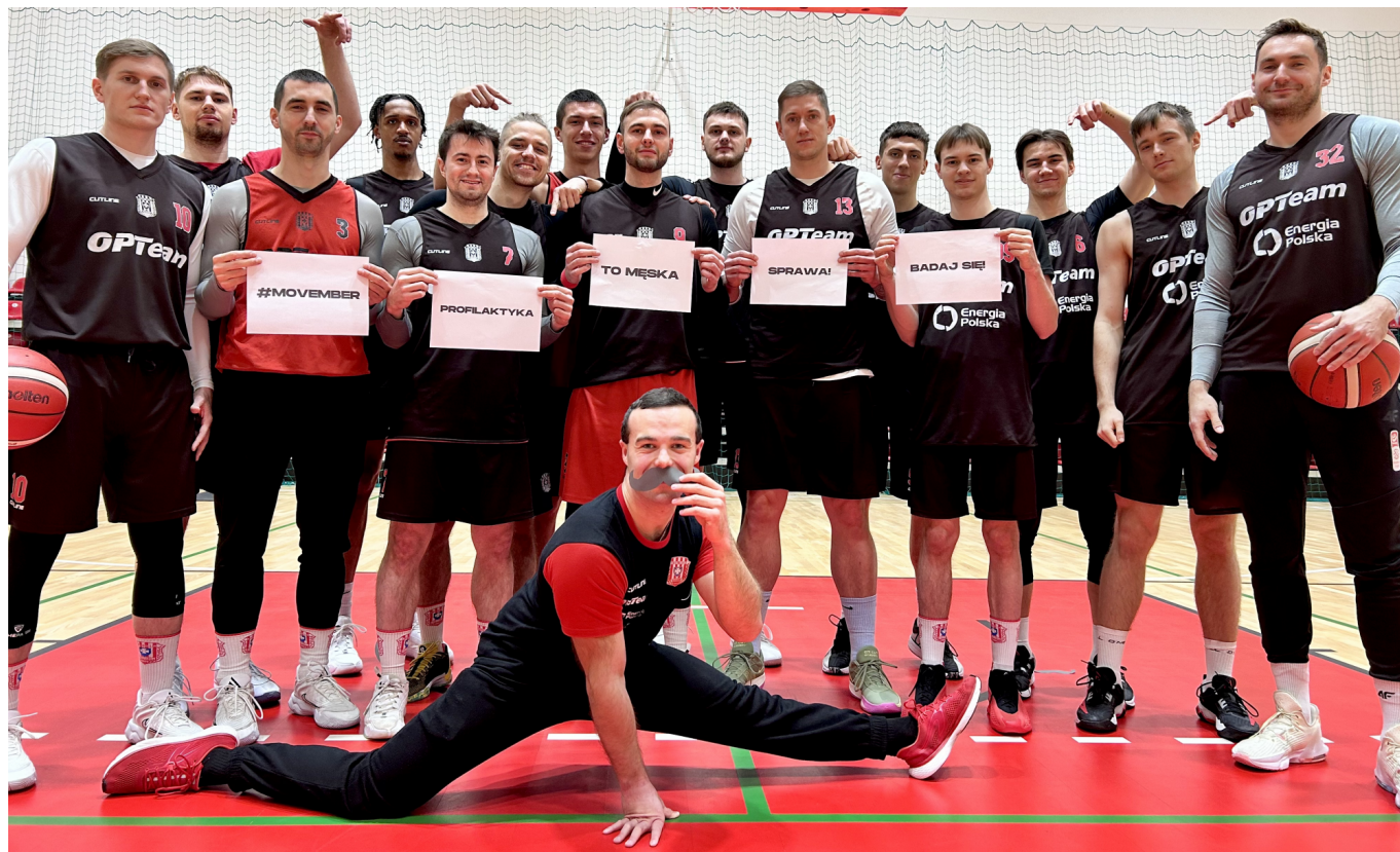
zdjęcie drużyny koszykarskiej OPTeam Energia Polska Resovia Rzeszów wspierającej akcję "Profilaktyka to męska sprawa"