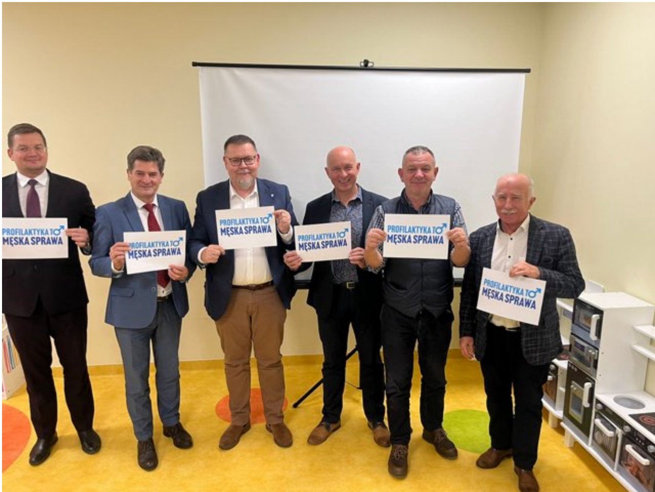
zdjęcie przedstawicieli administracji samorządowej w mieście Rzeszów wspierających akcję "Profilaktyka to męska sprawa"