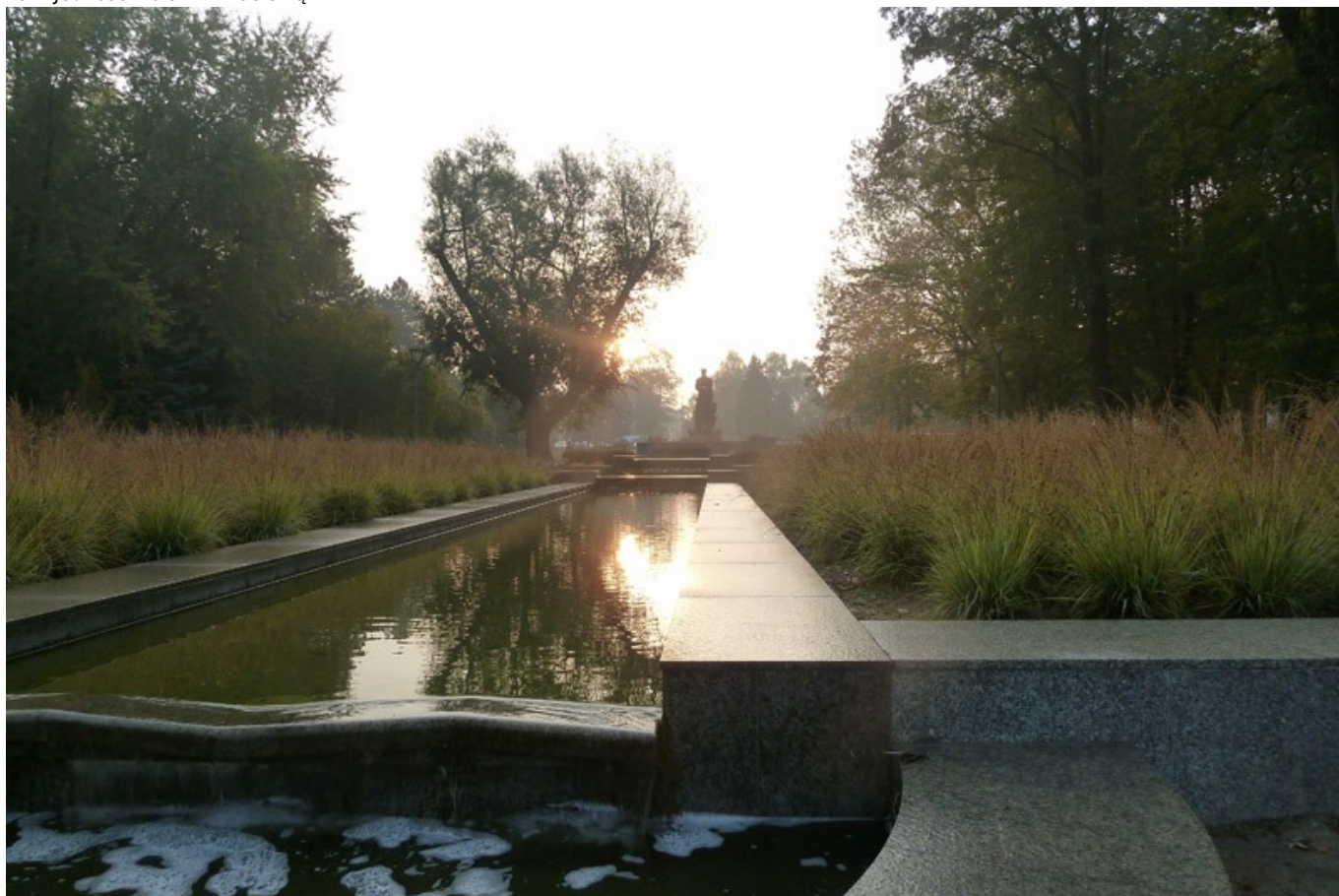
Park Jedności Polonii z Macierzą