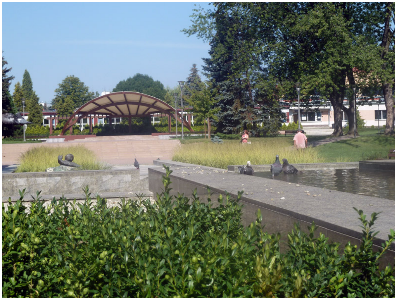
Park Jedności Polonii z Macierzą