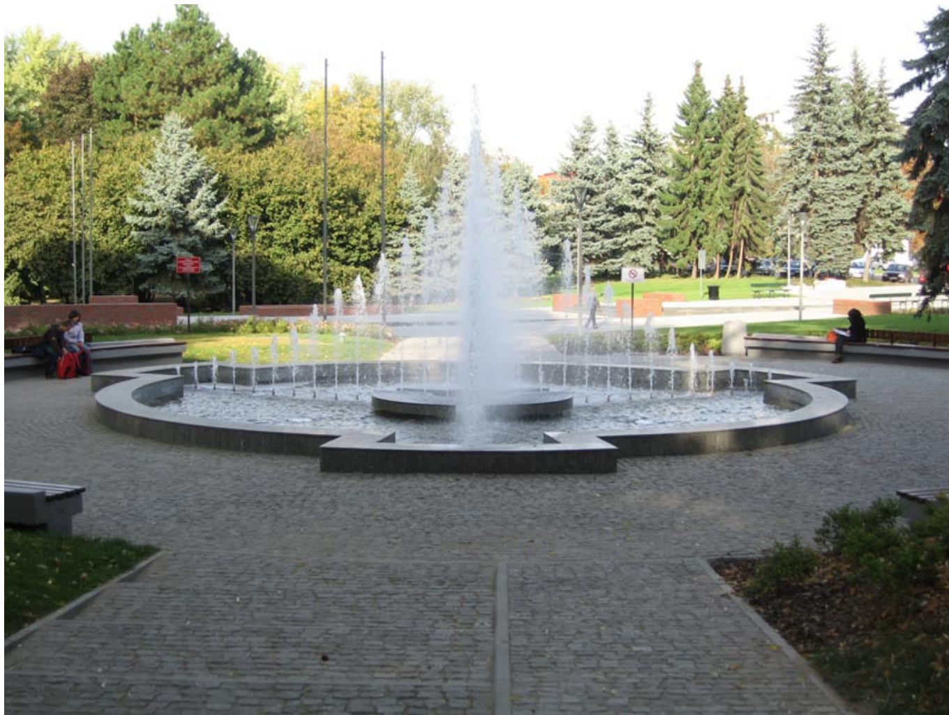
Park Jedności Polonii z Macierzą