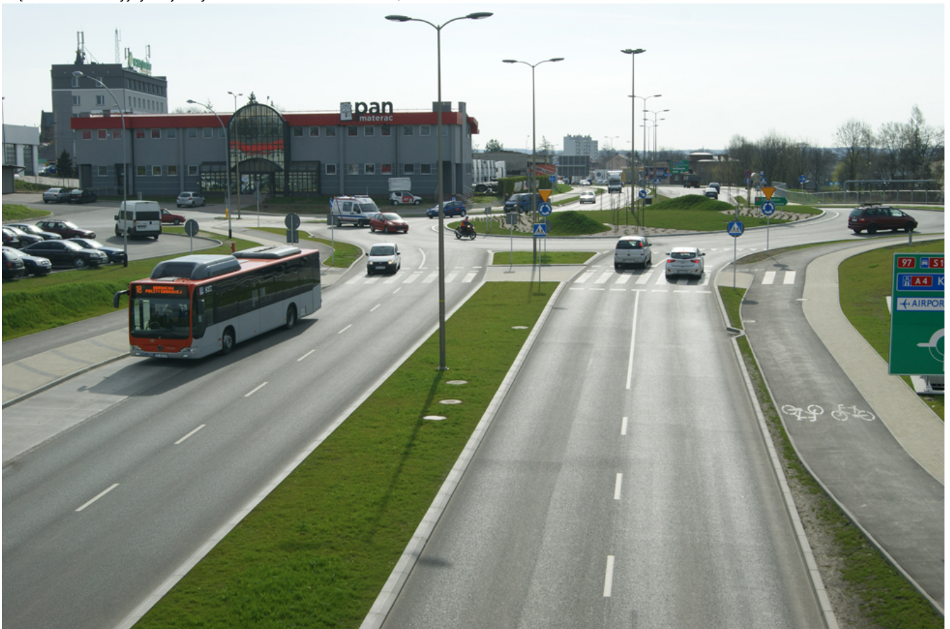
Węzeł komunikacyjny aleja Wyzwolenia - ulica Warszawska

W niedzielę, 26 października 2014 r. odbyło się uroczyste oddanie do użytku kluczowego węzła komunikacyjnego aleja Wyzwolenia - ulica Warszawska w Rzeszowie. W uroczystości wziął udział prezydent RP Bronisław Komorowski.