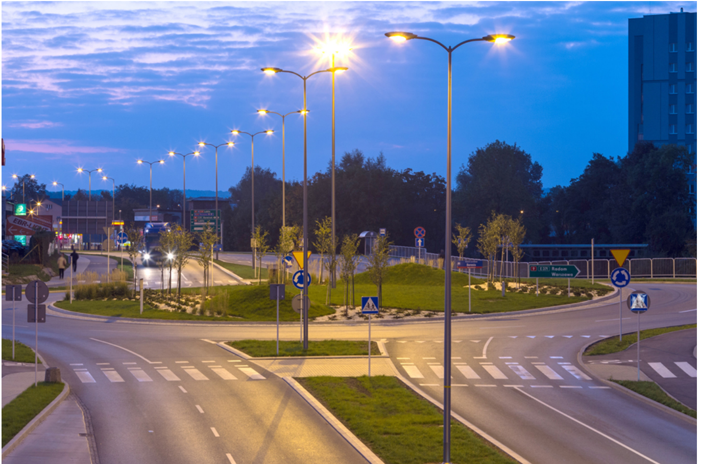
Węzeł komunikacyjny aleja Wyzwolenia - ulica Warszawska