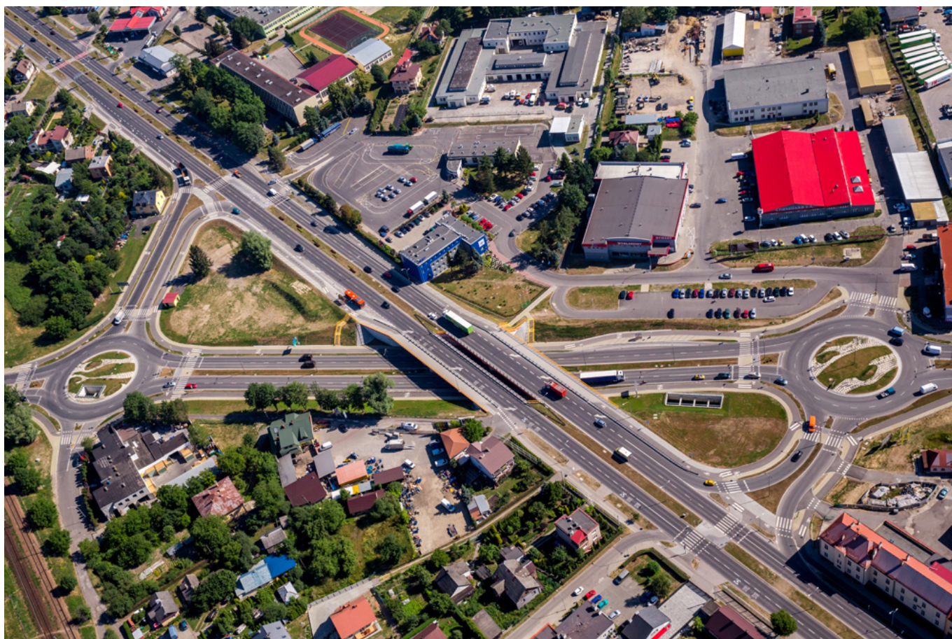
Węzeł komunikacyjny aleja Wyzwolenia - ulica Warszawska