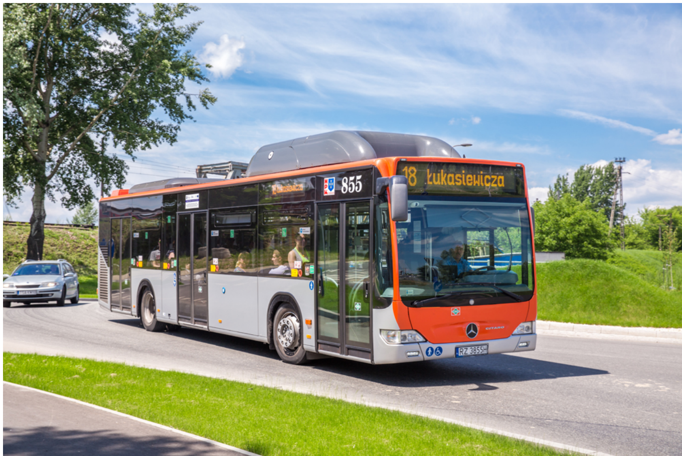
Węzeł komunikacyjny aleja Wyzwolenia - ulica Warszawska