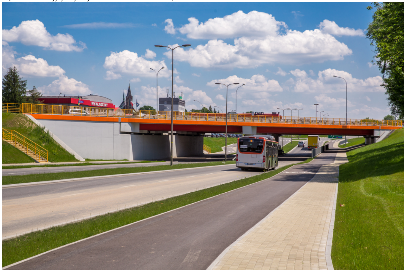
Węzeł komunikacyjny aleja Wyzwolenia - ulica Warszawska