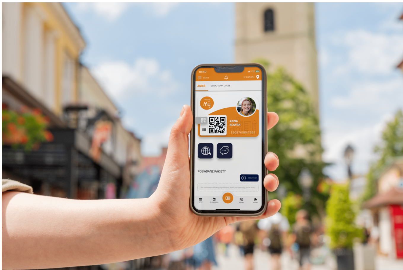
zdjęcie wizualizacji aplikacji Rzeszowska Karta Mieszkańca