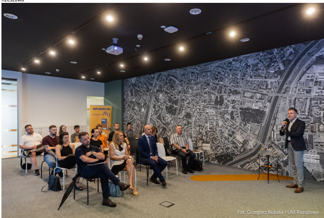
Fot. Grzegorz Bukala / UM Rzeszowa

spotkanie z przedsiębiorcami dotyczącego włączenia usług do aplikacji Rzeszowska Karta Mieszkańca, fot. Grzegorz Bukala, Urząd Miasta Rzeszowa